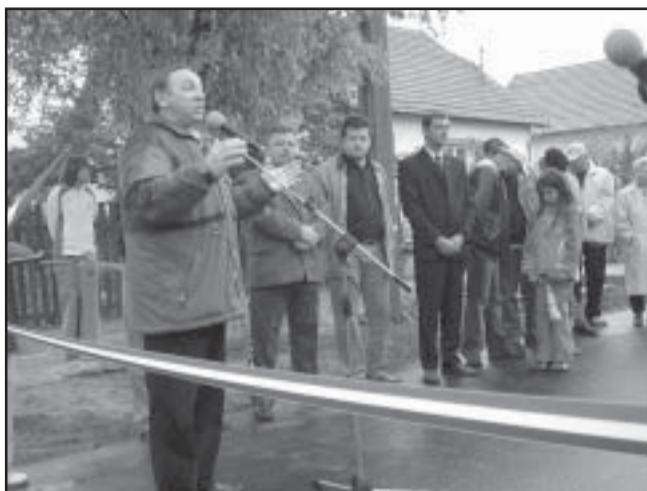
Az átadási ünnepségen Sarkad polgármestere a mikrofonnál