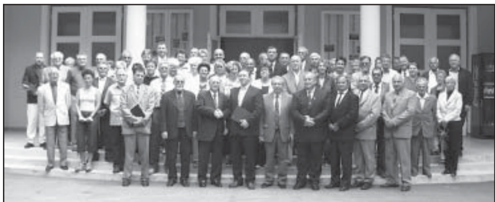
A sarkadi képviselő-testület tagjai és a német vendégek az ünnepi testületi ülés után

(Tudósításunkat a német delegáció további sarkadi programjáról következő lapszámunkban folytatjuk)