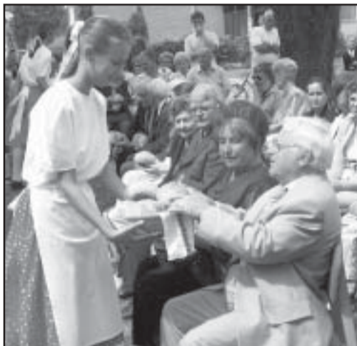
Jelképes „kiskenyeret” kaptak a vendégek

Az ünnepség a szózat közös eléneklésével ért véget. -s-