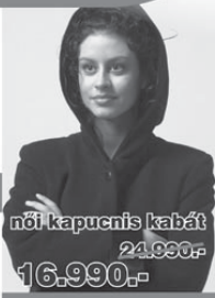
női kapucnis kabát 24.990,- 16.990,-