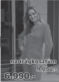
nadrágkosztüm 9.990,- 6.990,-