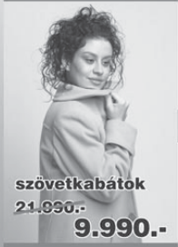
szövetkabátok 21.990,- 9.990,-