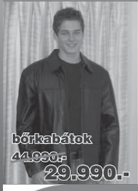
bőrkabátok 44.990,- 29.990,-