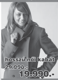
hosszú női kabát 29.990,- 19.990,-

Női-férfi bőrkabátok szezon előtti áron, egységesen 29.990 Ft-ért