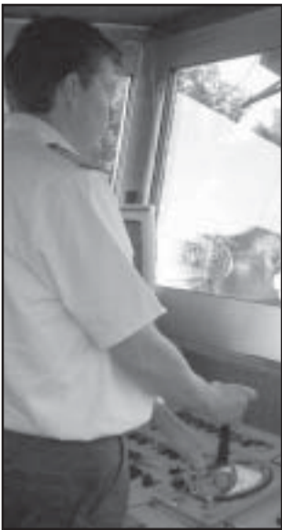
A hajó kapitánya