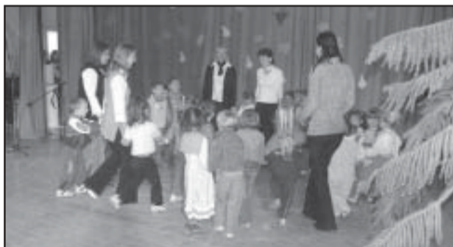
Népi dalos játékok, mondókák felelevenítése

A Családsegítő Gondozási és Szociális Központ fenntartója Sarkad Város Önkormányzata, ezért a már meglévő és a most bevezetésre került új szolgáltatásaink esetében is az állami felelősségvállalás kiterjed a szakmai munka minőségére, a szolgáltatások folyamatos biztosítására.