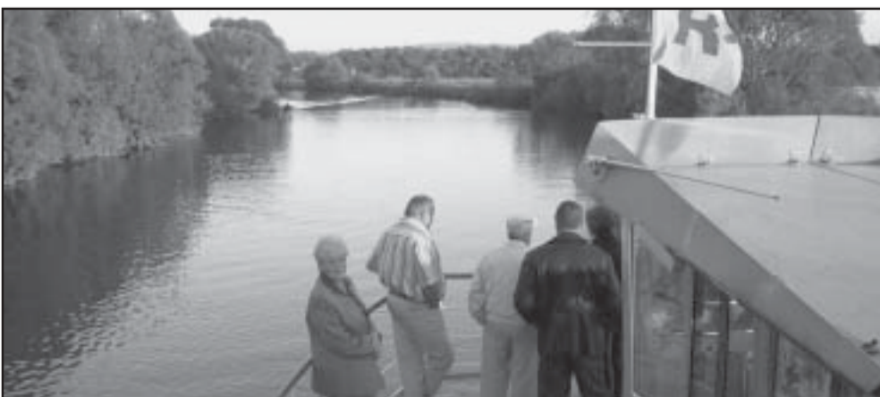
Kiérve a város körzetéből...