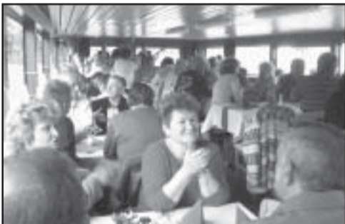
A középső fedélzet: vendégek és a 30 éve alapított tűzoltózenekar