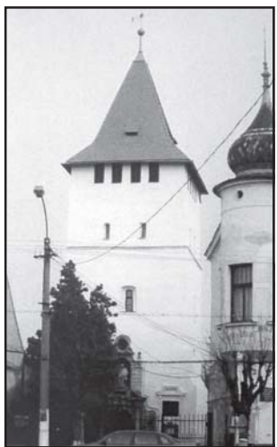
...és ilyen lett