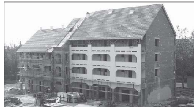
Egy archív kép a félig kész önkormányzati bérlakásról. Ma már megszokott látvány az épület