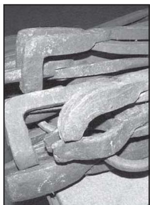
Különböző fogók és formázókalapácsok