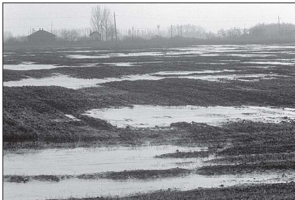
Sarkadi külterület. Békés megyében mintegy 17 ezer hektárt borít belvíz