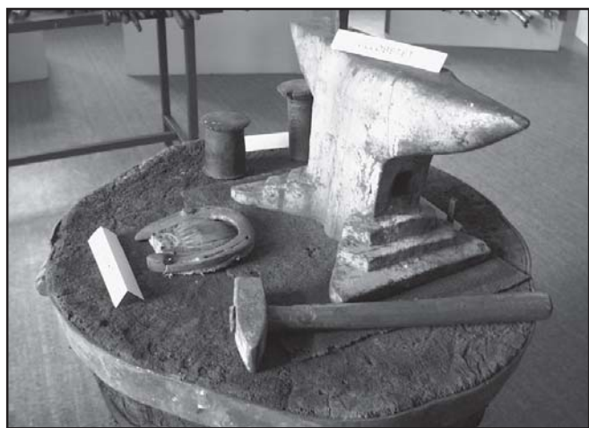
Egy balkezes kovácsmester üllője