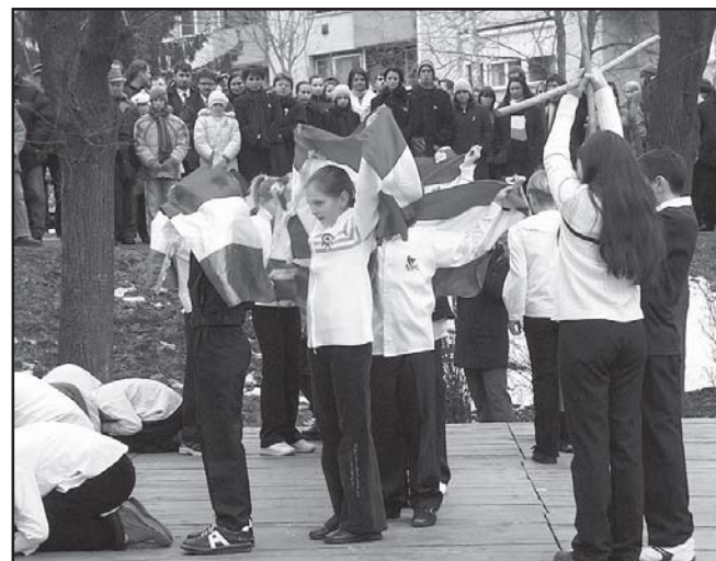
2. Sz. Általános Iskola diákjai

Európa nagy rendező pályaudvarán sikerült egy keletre nyugatra tartó vonat peronjára felkapaszkodnunk kilenced magunkkal. A peronról üzennek nekünk Európa vezetői, hogy jogaink azonosak, de közben eltérő módon alkalmazzák, ha ró-lunk van szó. Fel kell tennünk az elődeink által megfogalmazott kérdést most 2006-ban is. Rabok legyünk, vagy szabadok? A válasz (Folytatás a 2. oldalon)