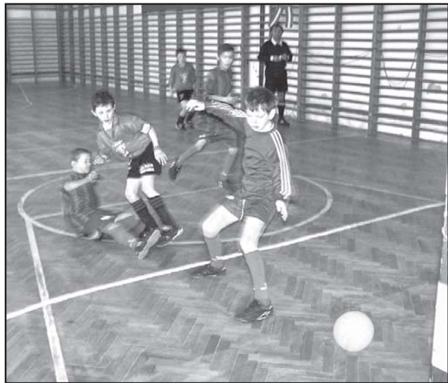
Március 15. Kupa első mérkőzésének egy pillanata

10.00 Sarkadkeresztúr SE - Sarkadi Kinizsi serdülő mérkőzés