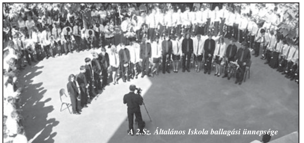
A 2.Sz. Általános Iskola ballagási ünnepsége