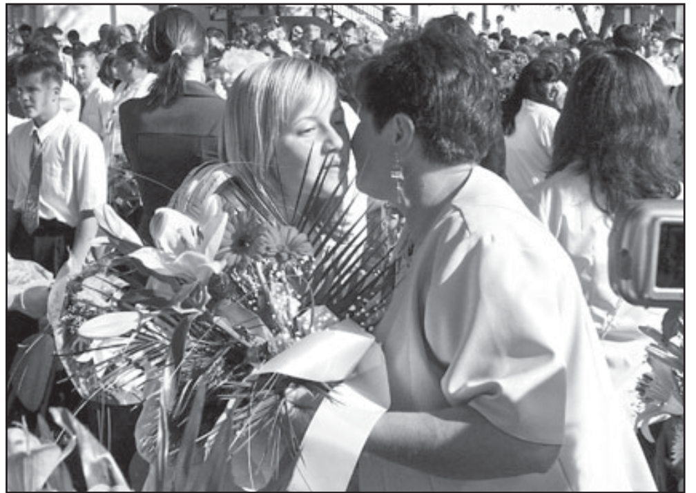
Az 1.Sz. Általános Iskola ballagási ünnepsége

Május 27-én az 1.Sz. Óvoda (Szalontai u. 17.sz.) tartotta ballagási búcsúztató ünnepségét, melyen az önkormányzatot Tóth Edit művelődési munkatárs képviselte.