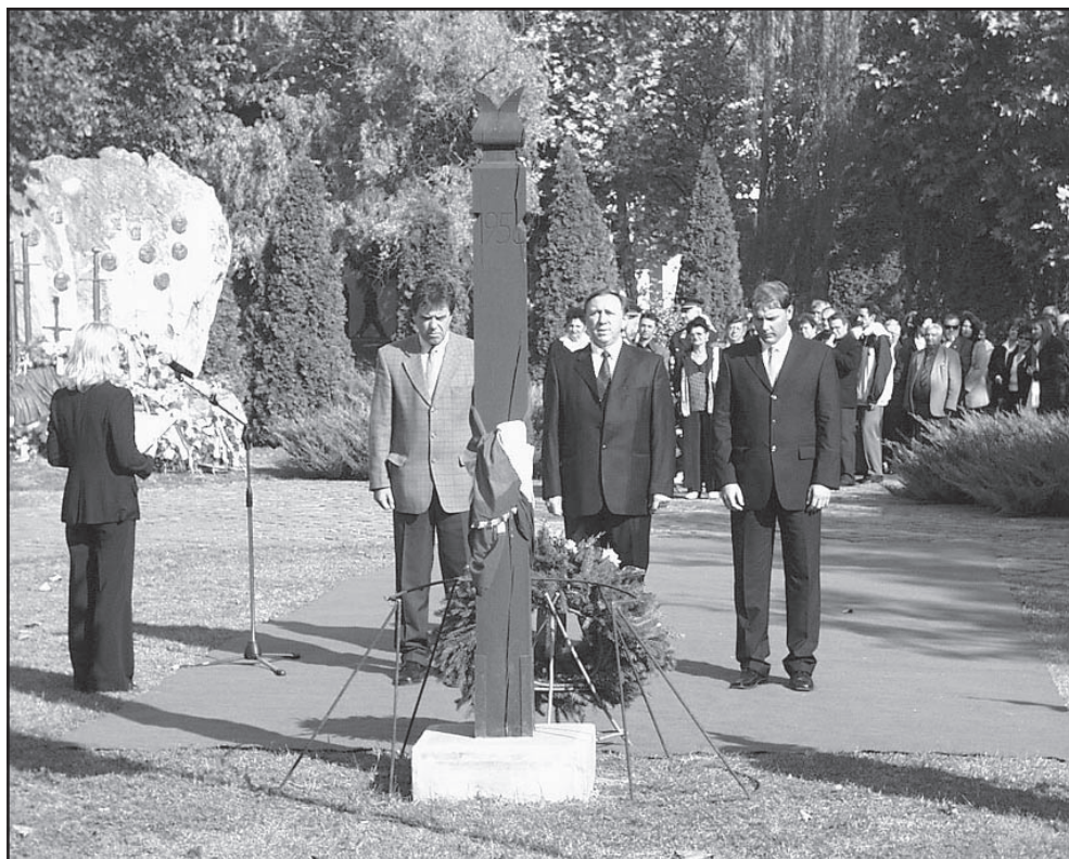
Az emlékezés koszorúit a Vértanúk terén felállított kopjafájánál elsőként a város vezetése helyezte el

Sarkadon az 1956-os forradalom és szabadságharc 50. évfordulója alkalmából rendezett városi díszünnepség október 23-án fél tízkor kezdődött a Sarkadi Rendőrkapitányság épületének utcai falán elhelyezett 56-os emléktábla koszorúzásával. A táblát a forradalom áldozatainak emlékére 1992-ben helyezte el a Sarkadi Politikai Foglyok Szövetsége.