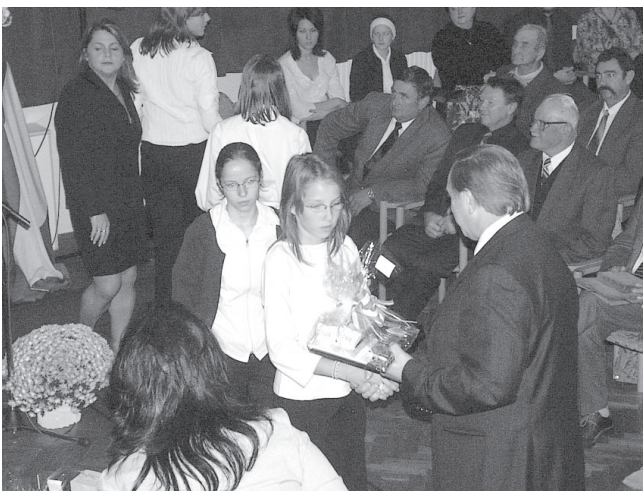
A 2. helyezett csapat az eredményhirdetésen

Az elmúlt hetekben a város oktatási intézményeinek tanulóit is sokat készültek az 1956-os forradalom és szabadságharc 50. évfordulójának méltó megünneplésére,