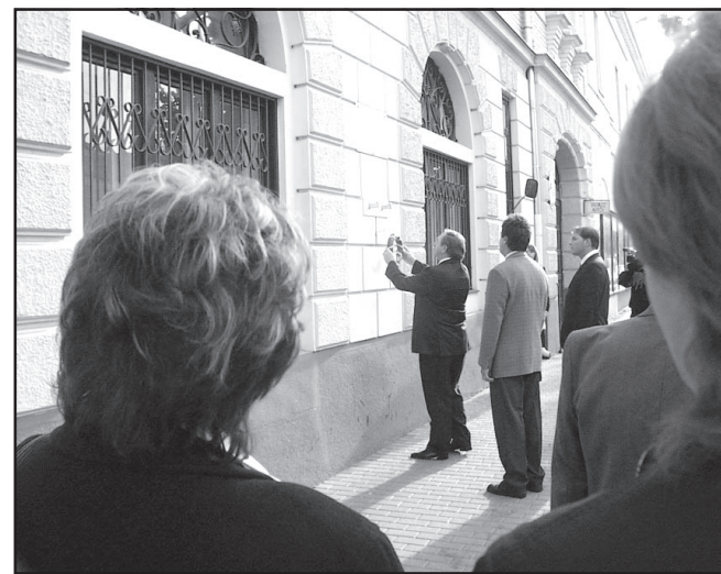
A kapitányság falánál kezdődött az ünnepi program