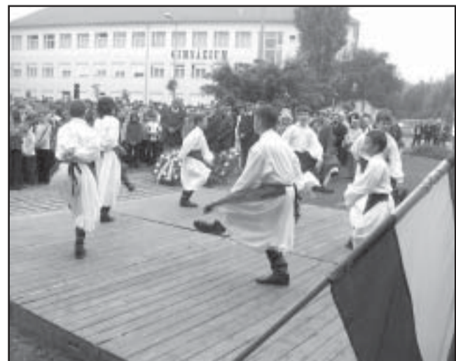
2. Sz. Általános Iskola néptánc csoportja