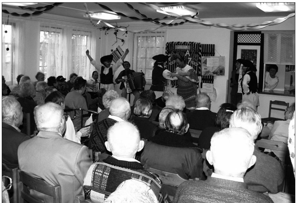
A csikósok csikó nélkül, ám annál vidámabban...

Február a farsang ideje is és ezt a hagyományt a Családsegítő, Gondozási és Szociális Központ Idősek Otthonában évről évre ápolják. Február 14-én délután - talán a képeken is látható - a jókedv, a móka és a kacagás volt vendég a „Szociban”.