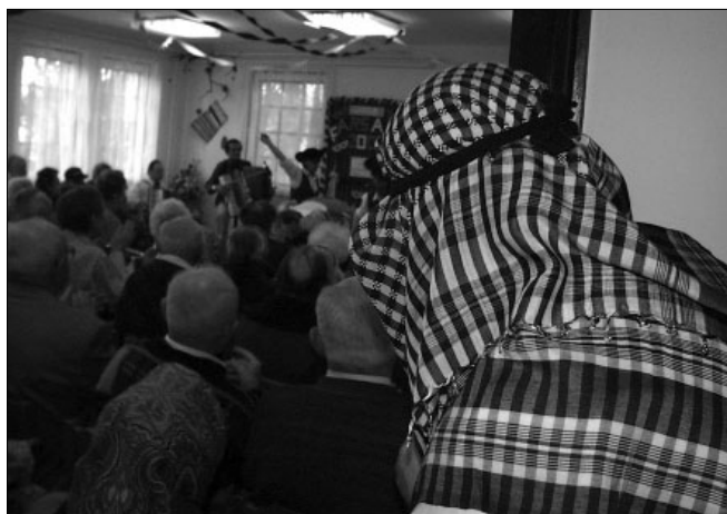
Az arabokat is érdekelte volna az esemény?