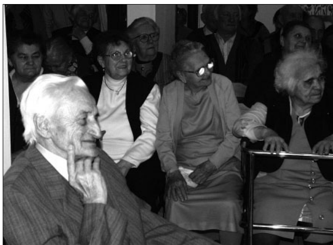
Akikért és akiknek készültek a jelmezek

Február a farsang ideje is és ezt a hagyományt a Családsegítő, Gondozási és Szociális Központ Idősek Otthonában évről évre ápolják. Február 14-én délután - talán a képeken is látható - a jókedv, a móka és a kacagás volt vendég a „Szociban”.