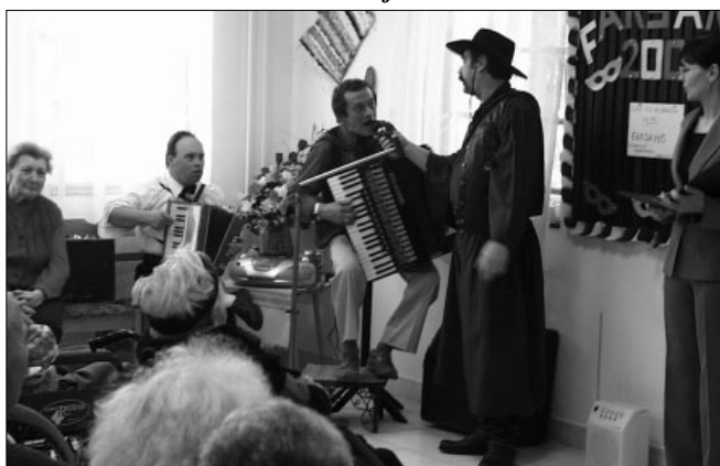
A sarkadi csikós....