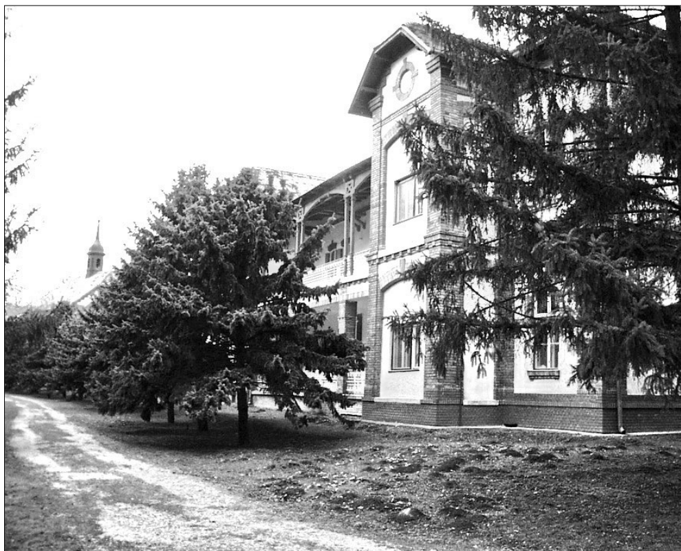
Száz éve gyógyítanak itt tüdőbeteg embereket

A gyurcsányi megszorító csomag „bűnlajstromának” következő áldozata?!