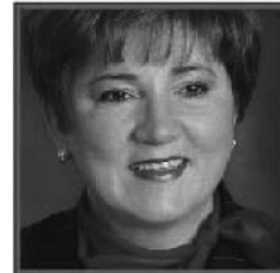
Dr. Lamperth Mónika miniszter, MSZP