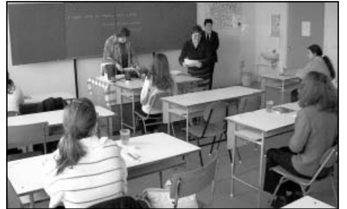
Ismertetik a tollbamondási feladatot

Sarkad, 2. Sz. Általános Iskola 7. évfolyam