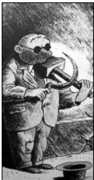
„A legvidámabb barakk” (Magyar Enciklopédia)