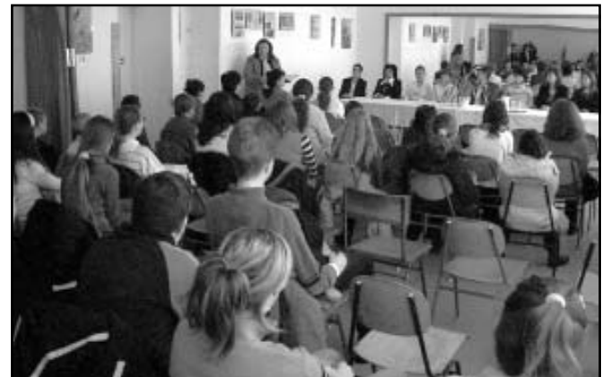
A megnyitó pillanatai

a verseny szervezője, az 1. Sz. Általános Iskola humán munkaközössége