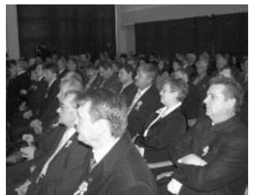
...és Békés megye képviselő-testületének tagjai