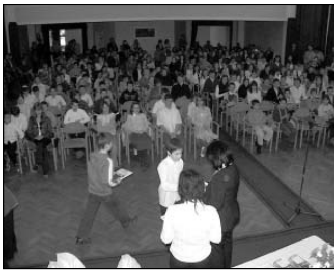
Zsúfolásig megtelt a Bartók Béla Művelődési Központ nagyterme

Különdíjat vehettek át eredményes szereplésükért