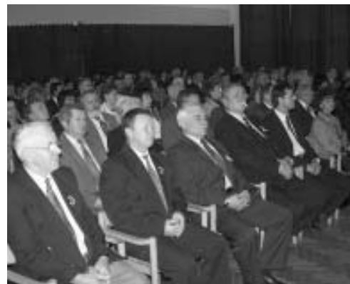
Sarkad képviselő-testületének tagjai...