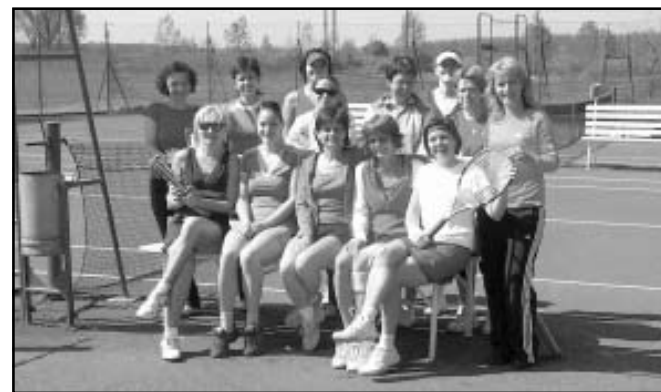
A női kupa résztvevői