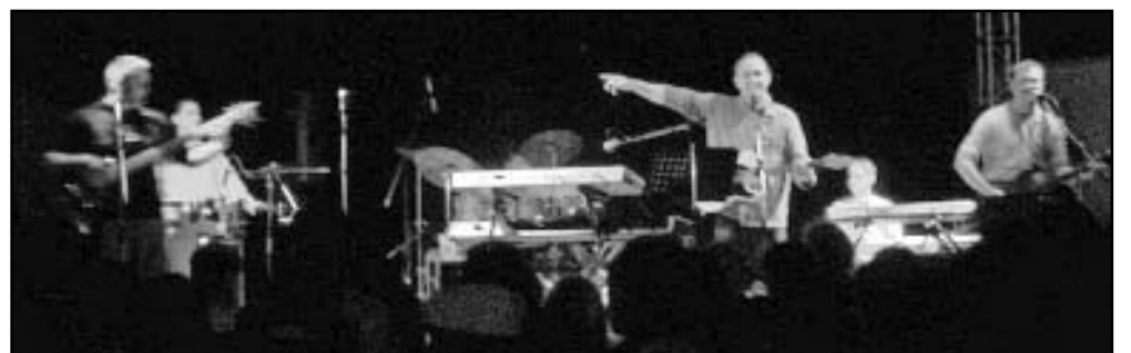
Az esti talpalávalót a Grund együttes szolgáltatta