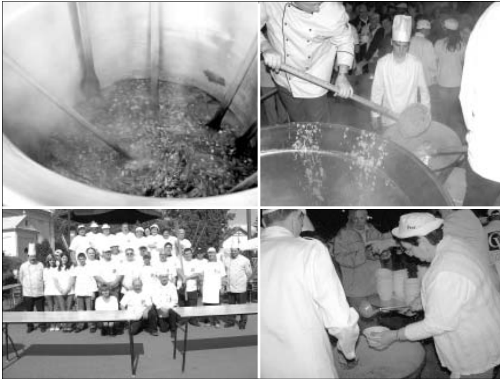
Az 1 000 adagos Sarkadi Öregtarhonya készítői és fogyasztói (április 30.)