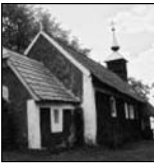
Salvator kápolna Csík- somlyó

Csíksomlyói búcsú Az egyik legfontosabb ma- gyar Mária-kegyhely Csík- somlyón található. A 15. szá- zadból maradt fenn az első írásos emlék, amely beszámol a pünkösdi zarándoklatról. A katolikus hívek pünkösöd- szombatra érkeztek meg a csíksomlyói kegytemplom- hoz, majd mise után felvon- ultak a két Somlyó-hegy közé. A népszokás ma is élő hagyomány, a csíksomlyói búcsú a magyarság egyete- mes találkozóhelyévé nőtte ki magát.