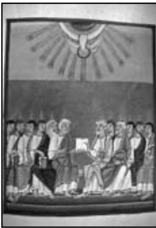
A Szentlélek megszállja az apostolokat. Kép a Bamberg Apocalypse-ból

A pünkösdi csoda ábrázó- lása ritka, s nem követi pon- tosan a Szentírásban foglal- takat. A 6-6 apostol karéjában, középen rendszerint ott ül Mária (az anyaszentegyház képviselőjében), s míg az apostolok feje felett 12 lán- gocská lebeg, Mária fölé a Szentlélek terjeszti ki szár- nyait galamb képében.