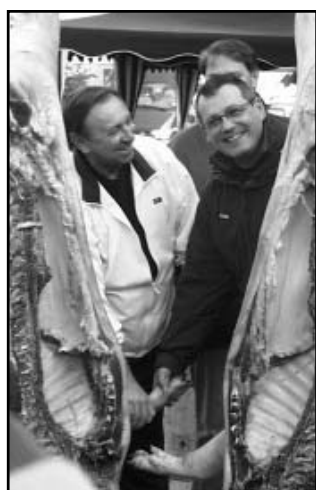
Népi hagyományink bemutatásaként hajnali disznóvágás