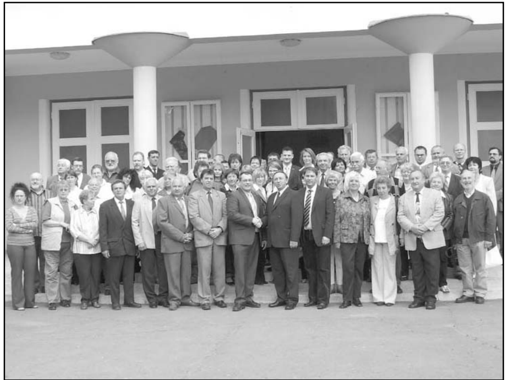
A Niestetal-i küldöttség és vendéglátóik, közös csoportképen a Művelődési Központ előtt

Magyarország településeinek jelentős része tart fenn és ápol testvértelepülési kapcsolatokat más országbeli városokkal és községekkel. Ez egy nemzetközileg kialakult gyakorlat, melynek lényege egymás életének megismerése, a népek barátságának erősítése és a kölcsönös előnyökre alapozott együttműködés kialakítása az élet minden területén.