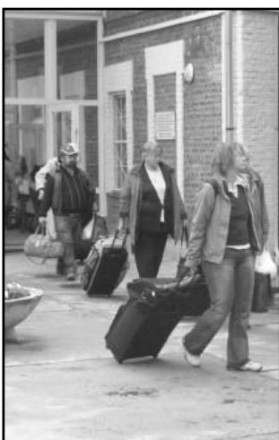
És a hazatutazás kezdete: csomagokkal a középiskolai kollégium előtt