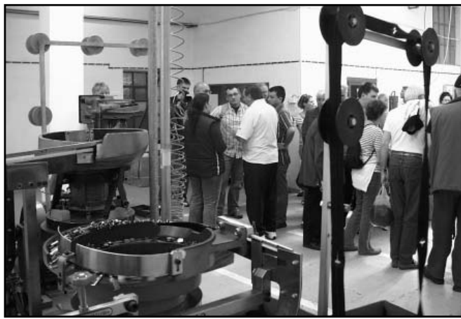
A küldöttség az UNIT cipzárgyárban is tett látogatást...

A testvértelepülési delegáció látogatása tehát számos eredményt hozott, s hozzájárult az önkormányzati intézmények, civil szervezetek, vállalkozások és családok közötti együttműködési lehetőségek további bővítéséhez. -kas