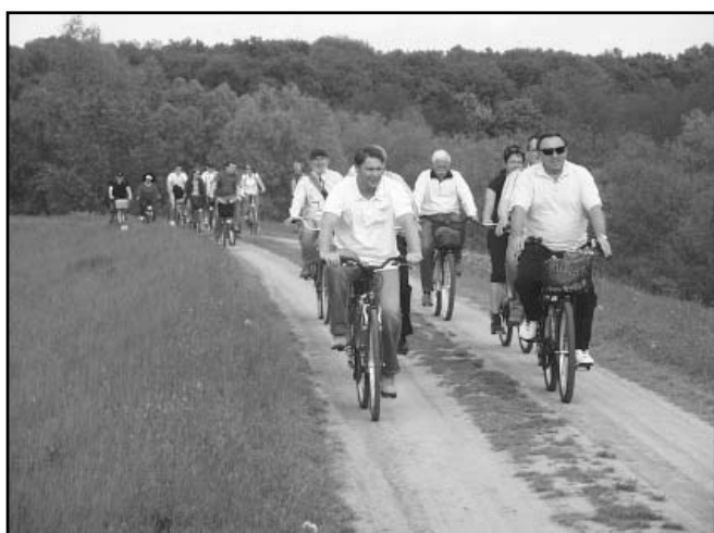
Turisztikai élménynek számított a Fekete-körös partján tett közös kerékpárút Sarkad -Városerdő között