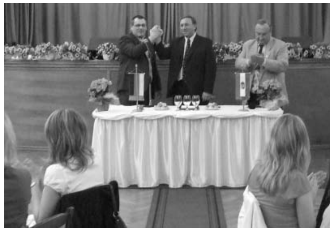
A barátság megerősítése a kézfogás