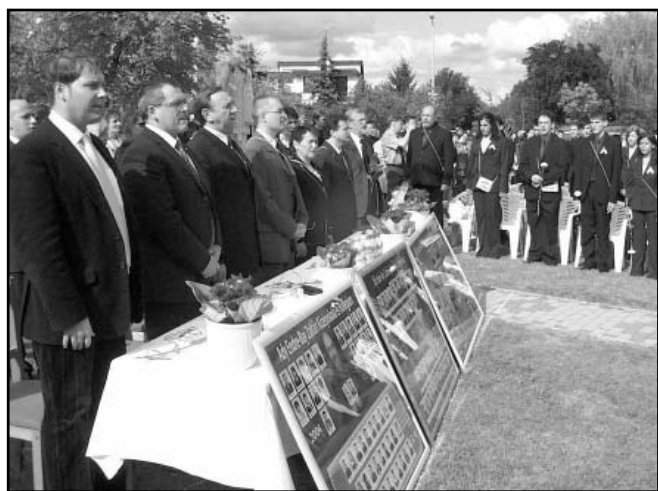
Németországi vendégeink az Ady Endre-Bay Zoltán Gimnázium, Postaforgalmi és Informatikai Szakképző Iskola balagási (búcsúztató) ünnepségén is részt vettek