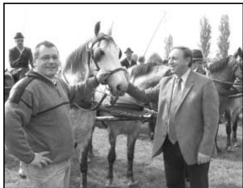
A Sarkadi Családi Majális valamennyi programjában részt vett Niestetal küldöttsége