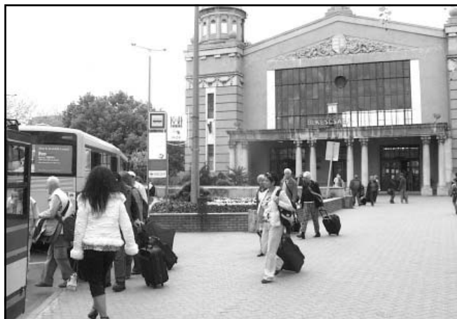
A békéscsabai vasúti pályaudvar: vonattal érkeztek a vendégek