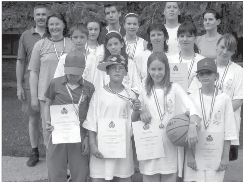
Csoportkép az eredmény kihirdetése után

Az országosan összesen 6-8000 tanulót megmozgató országos katasztrófavédelmi ifjúsági versenyt az idén immár 15. alkalommal rendezték meg. A kezdetek óta eltelt már másfél évtized, de az érdeklődés a téma és a verseny iránt töretlen. Hogy ez így is maradjon, kicsit frissítették a dolgot – az elmélet egy kicsit pontosabb, a gyakorlat kicsit színesebb lett.