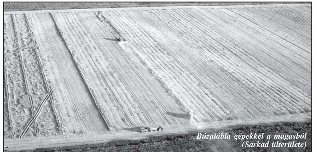
Búzatábla gépekkel a magasból (Sarkad külterülete)

Az aratás befejezése örömnappal számított, melyet a szokások és hiedelmek gazdagon átírtak. A (Folytatás a 2. oldalon)