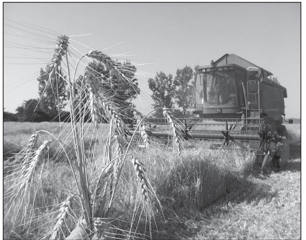
Kombájn az un. Matus-tanya környékén búza aratás közben

Az időjárásnak köszönhetően az idén Péter-Pál napja előtt kezdték aratni a gabonát országsszerte és akkor úgy tervezték, hogy 20 nap alatt a raktárakban lesz a mag. Azóta befejeződött a betakarítás, azonban tovább tartott egy esős hét miatt, és ráadásul a magok minősége is leromlott. Az 5,6 millió tonna búza (országos adat) 60%-a felelt meg az étkezési követelményeknek, a többi takarmányozásra alkalmas csak. A termésátlag 5 tonna feletti volt hektáronként és ez az átlag a sarkadi területeken is megvolt. A gazdálkodók itt is végeztek a kalászosok vágásával és az aktuális munkákkal folytatják hétköznapjaikat. Bizonyára a kombájnok karbantartása is sorra kerül, hiszen a kukorica még hátra van. Mondhatnánk az elődőknek könnyebb dolguk volt, hiszen az aratás után a szögkecskék a sárlót, a kaszát, de viszont... és lehetne sorolni az ellentételek hosszú sorát amivel-amitől különbözött anno az aratás. De hogy is volt?