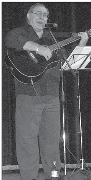
Mészáros Mihály színművész

Úgy gondolom, minden társadalom felelősséggel tartozik az időseiért, feladatának kell tekintenie azt, hogy erkölcsi és anyagi biztonságban érezhessék magukat, és megbecsülésük a mindennapokban is megragadható legyen.