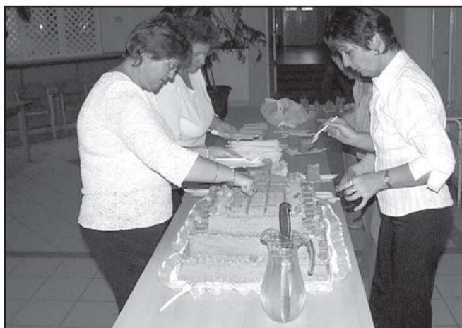
A polgármester és a városháza ajándéka volt az óriás torta, melyet a megjelent idősek a szünetben elfogyasztottak

Azon kell dolgoznunk, azért kell tevékenykednünk