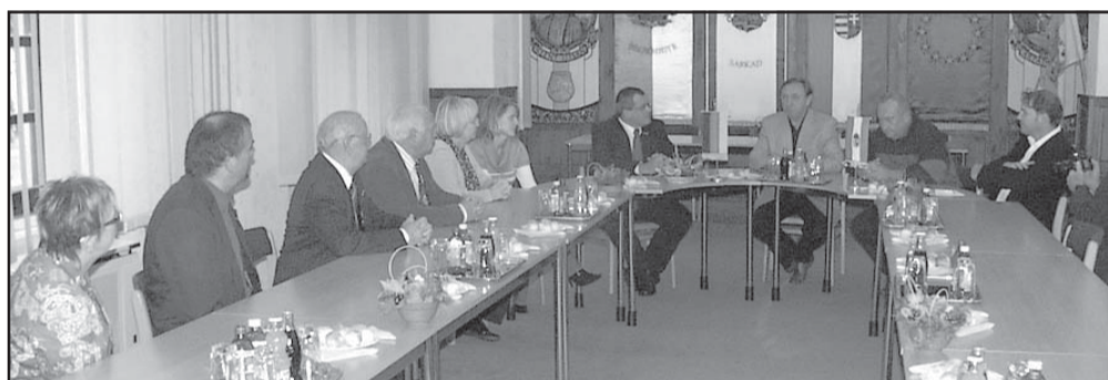
A tanácskozó teremben

gének finanszírozását Sarkad város általános iskolájában és középiskolájában, s egyházi, európai uniós kapcsolataikon keresztül segítséget ígértek a Sarkad Belvárosi Református Templomban található orgona felújításához is. -kas