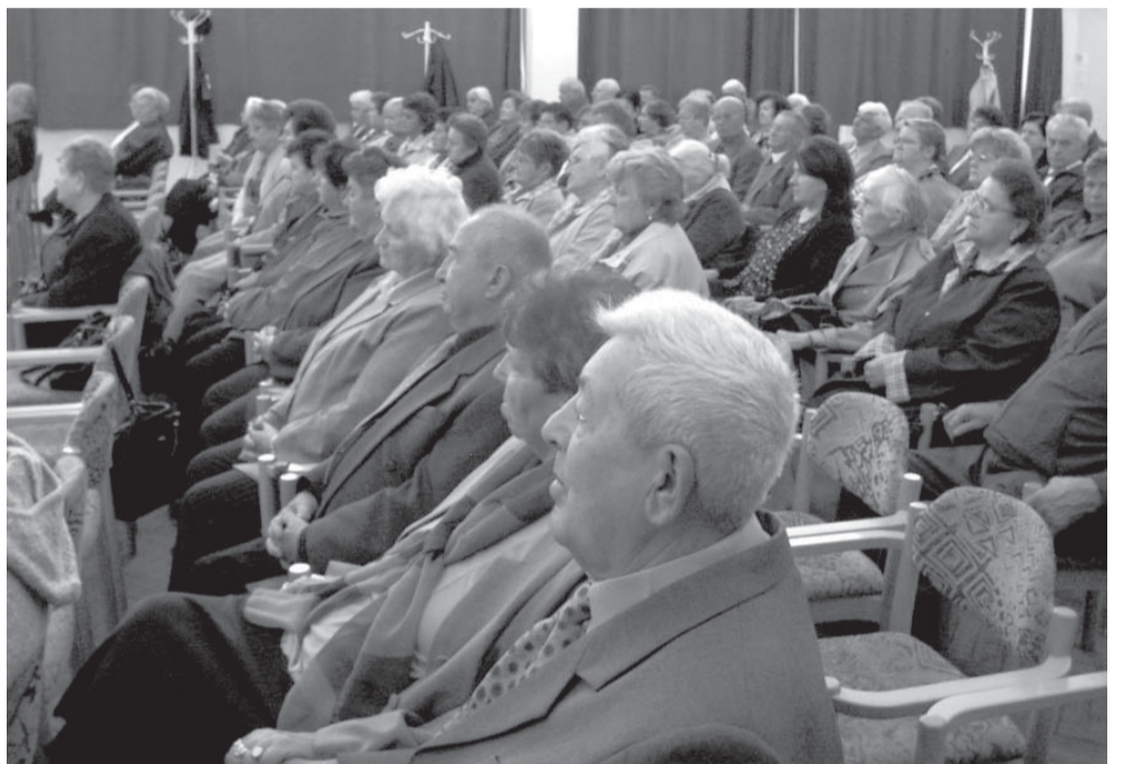
Az ünnepeltek egy csoportja

Az elmúlt héten tartotta a Nyugdíjasok Érdekvédelmi Egyesülete kulturális műsorral egybekötött megemlékezését az Idősek Napja alkalmából a város Művelődési központjában.