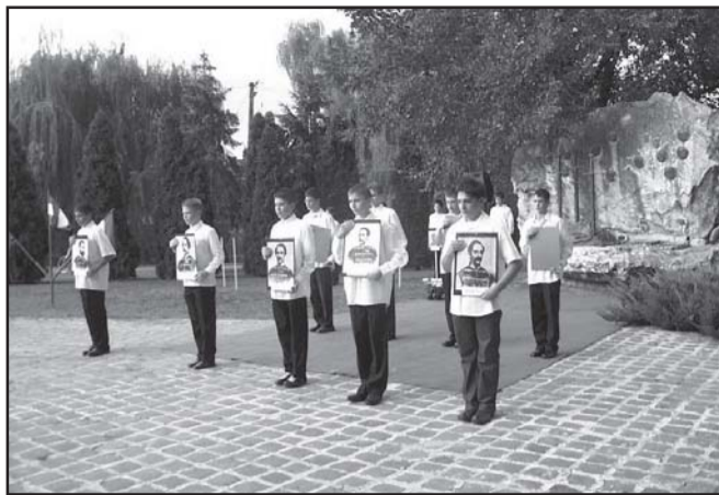
... és az rodalmi emlékműsor szereplői

– Éljen a haza! –hangzott Damjanich utolsó szava a bitón.