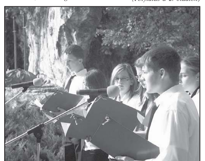
Az irodalmi emlékműsor „hangjai” és ...

A nemzet nem maradt hűtlen emlékükhöz. Az elnyomás éveiben titkon siratta őket a nép, ez időben országszerte terjedt egy német versike, amely az aradi tizenháromra emlékezett. Minden szavának első betűje emléket állít valamely aradi vértanú nevének: Pannonia Vergiss Deine Tode Nie, Als Kläger Leben