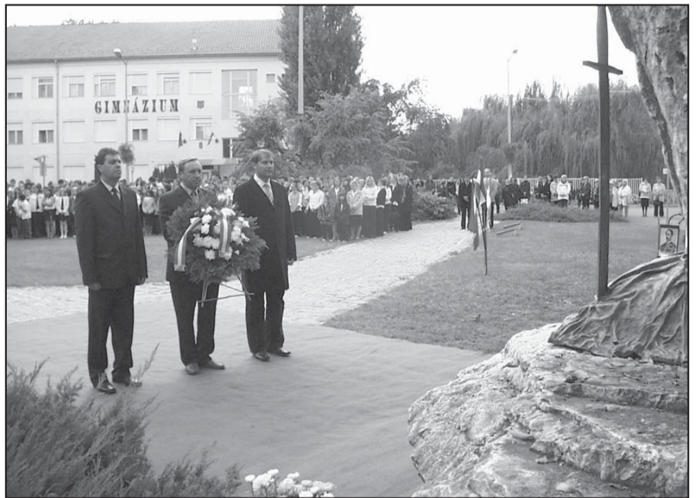
Az aradi vértanúk emlékművénél a város vezetése (képünkön) és valamennyi állami, társadalmi szervezet elhelyezte az emlékezés virágait

Százötvenkilenc évvel ezelőtt, október 6-án végezték ki – az osztrák megtorlás következményeként – Aradon azt a 13 honvéd főtisztet, akik az 1848-49-es magyar szabadságharc lezárásaként Világosnál tették le a fegyvert, megadták magukat. Erre emlékezve városi ünnepségre került sor a Vértanúk terén, mely a Himnusz közös elénekülésével kezdődött.