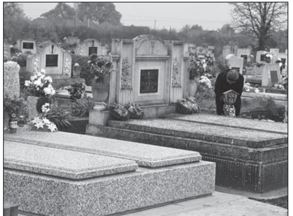
Halottak napján kimegyünk a temetőbe...

Halálról, halottakról nem igen szoktunk beszélni, tanulmányokat írni. Inkább csak járulékosan gyászjelentése, elhaltak értékelése rendjén. Tény azonban az, hogy a dolgokban mindnyájan érdekeltek vagyunk, sőt közügyünk. Erre figyelmeztet a latin közmondás: „emlékezz halálodra” (memento mori!). Nem véletlen az, hogy államilag az emlékezést ünneppé nyilvánították. Nemzetközi és globális rendetlen rendje a halál az emberiség életének?