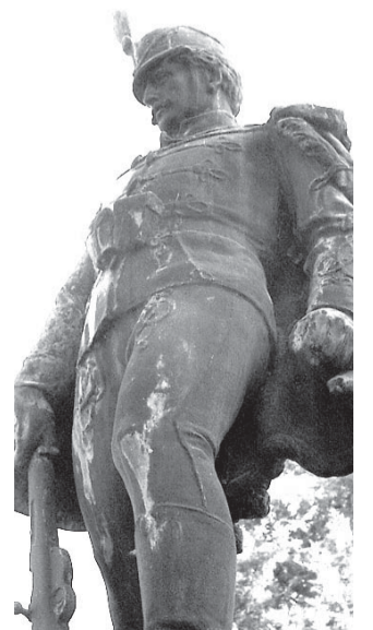
Fölöttük néma bronzharcos és a csillagos ég....

Volt egyszer 427 sarkadi férfi, akiknek csak halálhíre érkezett haza. Életre, szerelemre vágyó legények és kéréses tenyerű, őszülő családapák. A Sarkadról hadrakelt bakák (18-50 életév között) kb. 20%-a jeltelen sírokban, idegen földön alussza örök álmát. Az első világháborús emlékmű talapzatán 427 név. Előttük a Szent Korona és a remény szavai: „Megvirrad még valaha, nem lesz mindig éjszaka a magyar-nak”