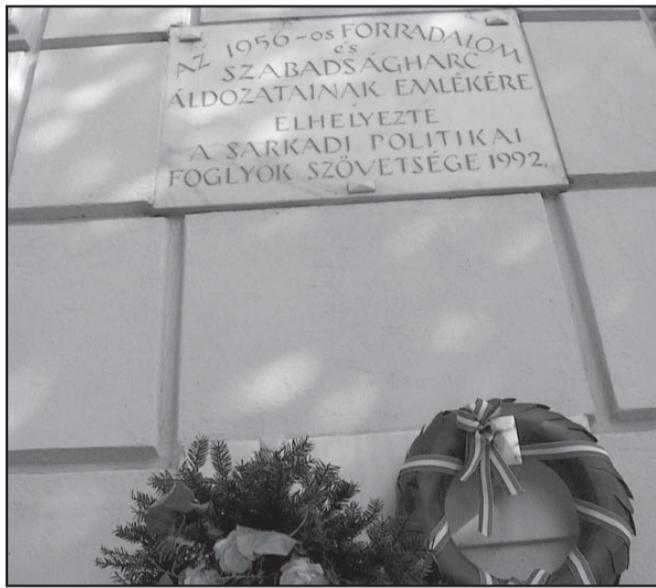
Az '56-os tábla a rendőrkapitányság épületének falán

Nem tudom feltűnt-e Önöknek, hogy a forradalmárokat