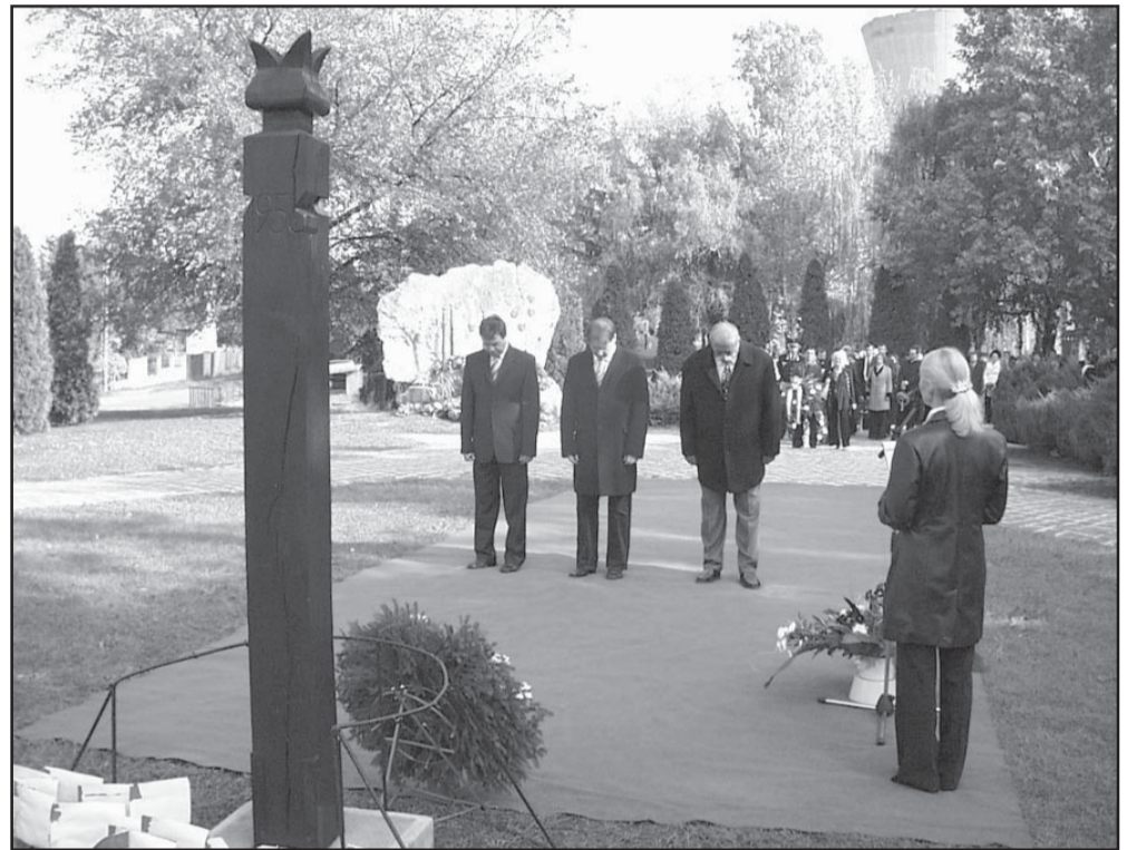
Az '56-os kopjafánál elsőként a város vezetése helyezte el az emlékezés virágait

Az 1956. évi forradalom és szabadságharc kezdeté-nek, valamint a Magyar Köztársaság 1989. évi kikiál-tásának napja alkalmából október 23-án délelőtt 10. órakor városi megemlékezésre került sor a Vértanúk terén. Fél órával korábban az ünnepségre összegyűlt sarkadiak a Városi Rendőr-kapitányság utcai falán el-helyezett 56-os emléktáblánál helyeztek el koszorút.