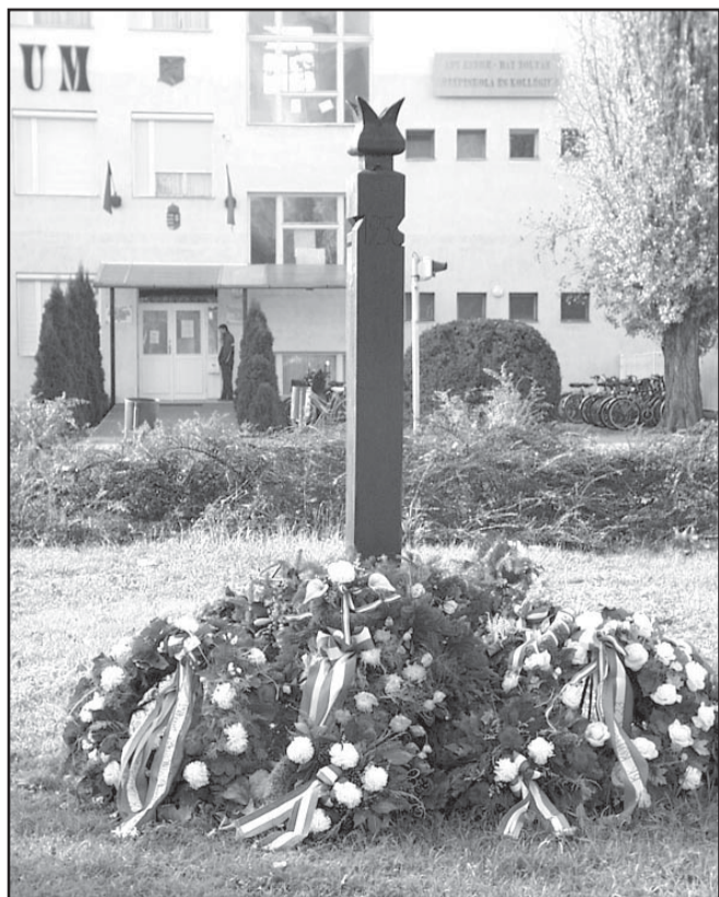
Sarkad '56-os emlékhelye