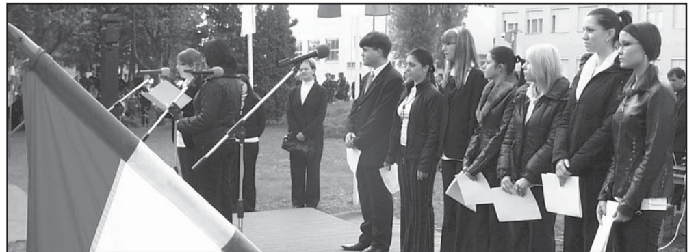
A középiskolások irodalmi emlékműsora