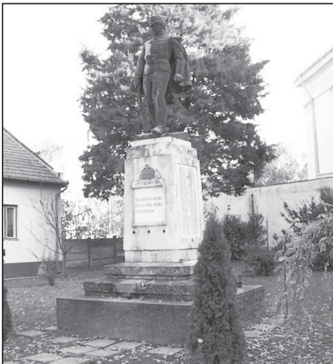
Emlékmű az első világháború sarkadról hadra kelt katonáinak