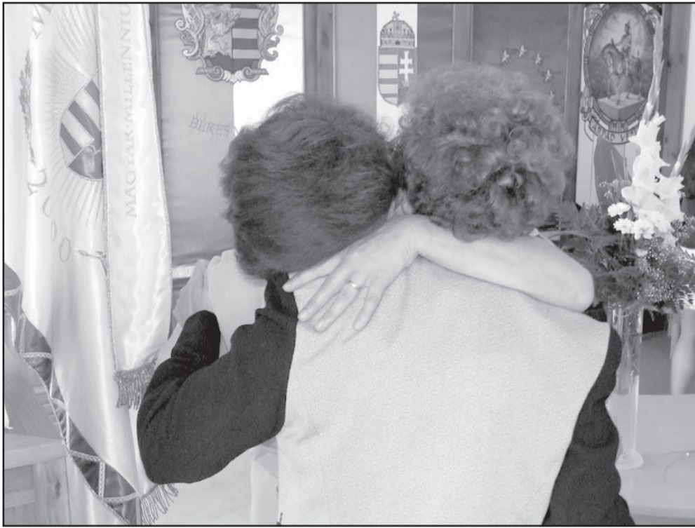
Felvételeink a sarkadi Vározháza azon ünnepi pillanatait örökítette meg, amikor felhangozhatott az állampolgári eskü