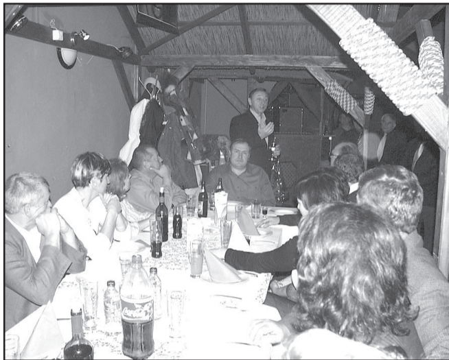
A polgármester „fehér asztalnál” köszönti a város iparosait

A közelgő ünnepekre szeretettel kívánunk békés, boldog karácsonyt, az újesztendőre jó egészséget, sok örömet és eredményes munkát egyesületünk valamennyi tagjának és Sarkad város lakosságának.