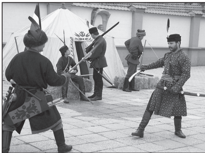
Archív képeinken a hajdúk korát idézték fel (2004.) városunkban történelmi játékok keretében