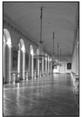
A Nagy Trianon-kastély és a terme, ahol a békeszerződést aláírták

Mottó: „Trianon, az egy mocskos dolog volt. Egy fölmérhetetlen katasztrófa.”