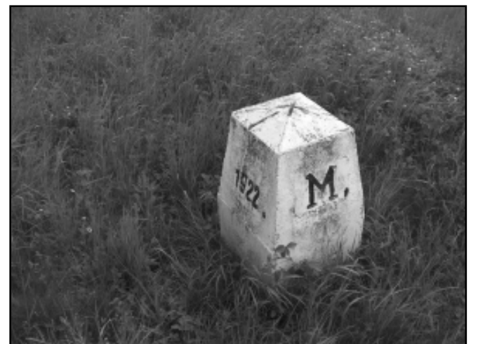
Határkő 1922-ből az új magyar-román határon