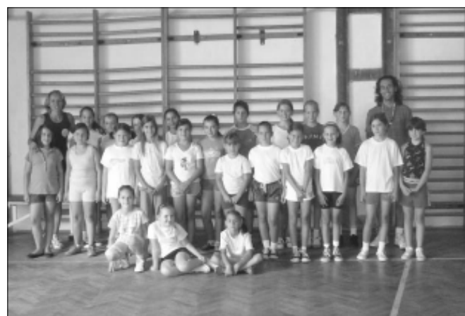
A sarkadi röplabdások csoportja