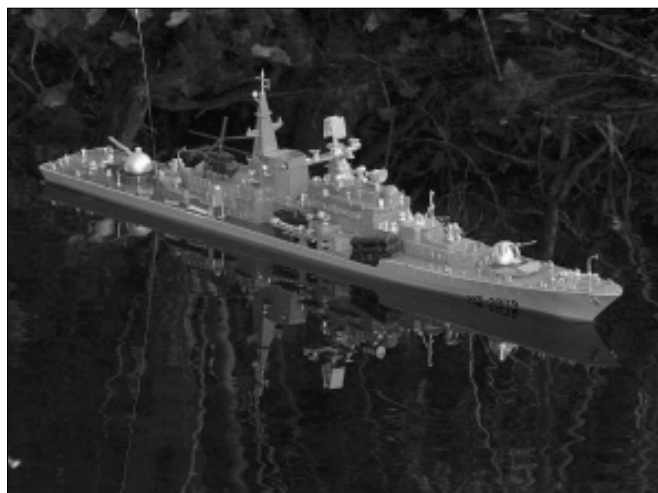
Egy szépen megépített romboló modell

A versennyel, vagy akár a hajómodellezéssel kapcsolatban bővebb felvilágosítást Plank Lászlótól kérhetnek az alábbi telefonszámon: 30/232-45-45 -S