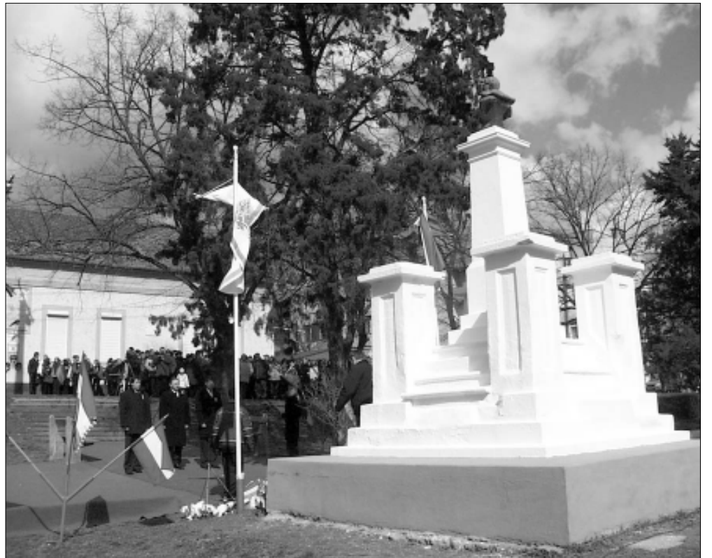
Elsőként a város vezetése helyezte el a Kossuth-szobor talapzatán az emlékezés koszorúját

Március 15-én megmutatkozott az „ajtóban álló” Sándor-József-Benedek hármast névnap tel utáni enyhülést, meleget hozó szándéka az időjárást illetően. Szeles, de napsütéses napra ébredt a város, ám akik a délelőtti folyamán a Kossuth-kertbe igyekeztek ünnepelni láthatóan nem a népi hiedelmek alapján öltöztek. Kokárdás télikabátokban érkeztek az 1848-49-es forradalom és szabadságharc 162. évfordulója tiszteletére rendezett városi megemlékezésre.