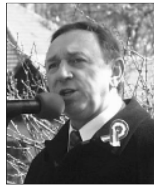
Tóth Imre polgármester

Március 15-én megmutatkozott az „ajtóban álló” Sándor-József-Benedek hármast névnap tel utáni enyhülést, meleget hozó szándéka az időjárást illetően. Szeles, de napsütéses napra ébredt a város, ám akik a délelőtti folyamán a Kossuth-kertbe igyekeztek ünnepelni láthatóan nem a népi hiedelmek alapján öltöztek. Kokárdás télikabátokban érkeztek az 1848-49-es forradalom és szabadságharc 162. évfordulója tiszteletére rendezett városi megemlékezésre.