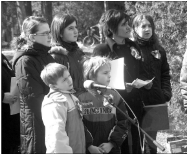
Azt emlékező irodalmi műsor előadóinak egy csoportja

Tisztelt ünneplők, kedves barátaim! 1848-ban is feltettek egy fontos kérdést: Mit kíván a magyar nemzet? Ma is ez a kérdés! Mit kíván a magyar nemzet. Ilyés Gyula egy helyen a következőket üzeni nekünk: „A rosszul megírt történelem visszajár”. A meg sem írt történelem pedig el sem megy. Itt van. Itt van a sorainkban, a mai magyar parlamentben is. Kossuthék a nemzetnek nem hazudtak sem reggel, sem délben, sem este. Cserébe bizalmat kaptak. A Kossuth-bankó aranyfedezetét közadakozásból gyűjtötték össze, az adományozóknak -köszönetül - vasból készült emlégyűrűt adva. Mit kíván a magyar nemzet ma? Érdelem érdemszerűen bíráljunk el. Akik a nemzet aranyát el tulajdonítják, elkótyavetyélik, cserébe kapjanak vasat. Bájós, diszkrét, csöndben