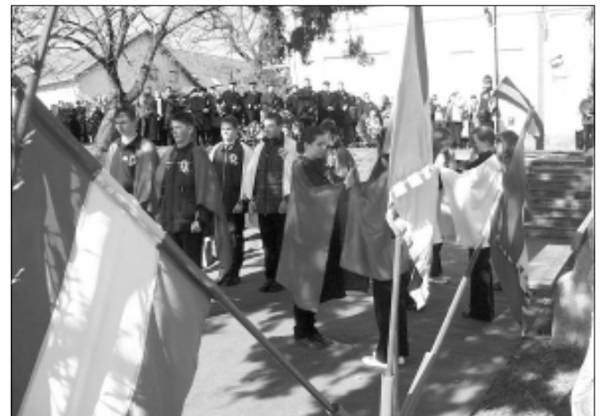
Az általános iskola diákjai