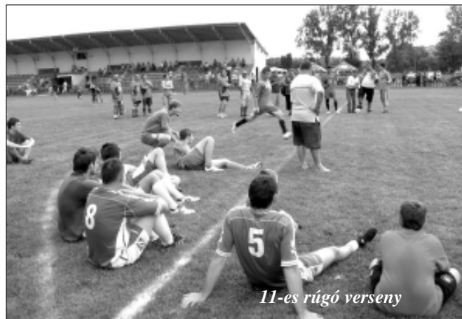
11-es rúgó verseny