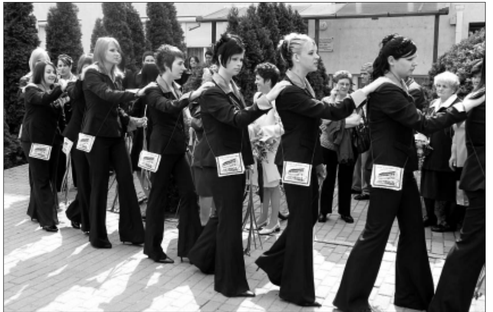
Nyolcvannyolc középiskolás diák nyakában került „ballagó tarisznya” az idén

Váci Mihály, Tóth Árpád, Radnóti Miklós, újabban Márai Sándor és még sok író-gondolkodó ember veretes mondataival indítják útnak a ballagókat általában. Kell a szellemei útravaló is a ballagó tarisznyában lapuló „hamuban” sült pogácsa mellé, hiszen a nagybetűs élethez vezető út hosszú. Ezen az úton a ballagás egy-egy állomás, fordulópont. Az óvodai ballagás a gondtalan kisgyermekkor elmúlását, az általános iskolai a kamaszkor végét jelzi, a középiskolai ballagás pedig a felnőtté válás ünnepe.