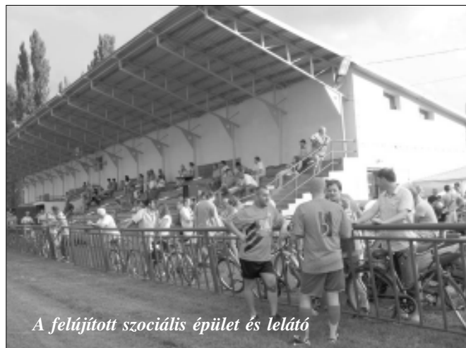
A felújított szociális épület és lelátó

Ahogy arról már korábban is beszámoltunk e lap hasábjain, Sarkad Város Önkormányzata 2003-ban vette át a Kinizsi Sportcentrum tulajdonjogát a Sarkadi Ipari Park tulajdonosától. Az önkormányzat rögtön hozzá is látott az erősen leromlott épületegyüttes felújításához, mely folyamat azóta is tart, s még számos tennivaló akad, de az eredmények már kézzelfoghatóak!