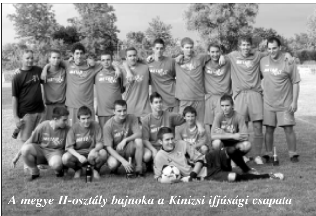
A megyei II-osztály bajnoka a Kinizsi ifjúsági csapata