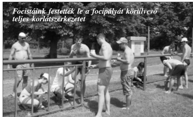
Focistáink festették le a foci pályát körülvevő teljes korlátszerkezetet

A sportcentrum felújítása kapcsán el kell mondani, hogy a felújítási munkákhoz társadalmi munka keretében a Kinizsi felnőtt és ifi csapata is önzetlenül hozzájárult, ugyanis 300 ezer forint értékű munkát elvégezve, a Városgazdálkodási Iroda irányításával focistáink festették le a foci pályát körülvevő teljes