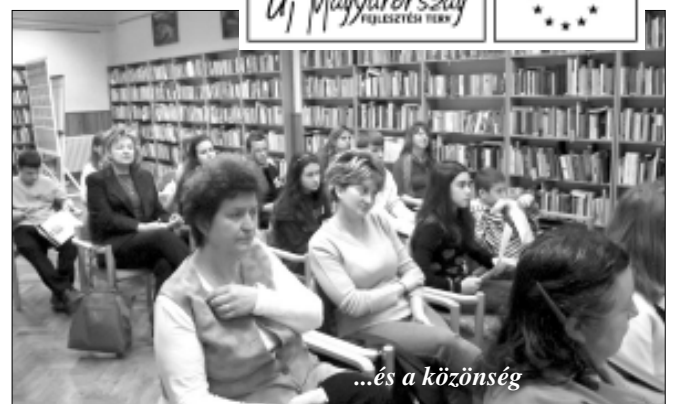
...és a közönség