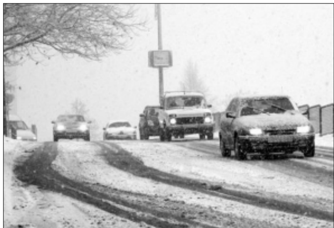
A közlekedésben a téli időszak tudatos felkészülést igényel

- Tájékozódjon az útviszonyokról/rádió, TV és KHT ügyeletek/.