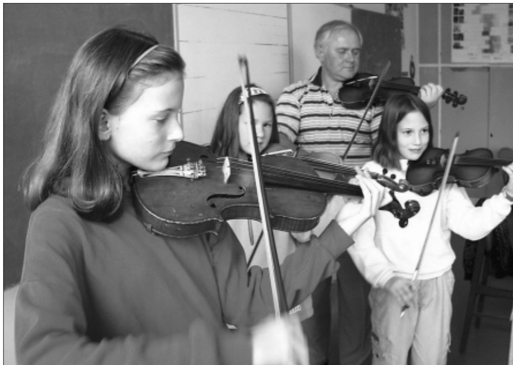
Archív kép az 1. Sz. Általános Iskola zenei oktatásáról (2002)

Sarkad Városában 2000. szeptemberétől működött művészetoktatás. A szolgáltatást a TALENTUM Alapfokú Művészetoktatási Intézmény, majd jogutódja, a BIBUCZI Kht. nyújtotta.