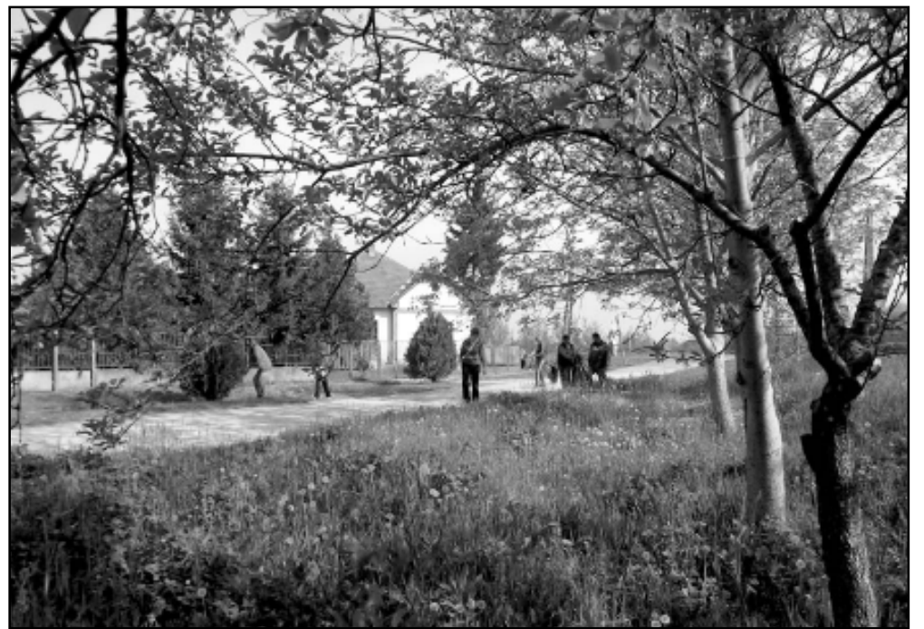
A Polgármesteri Hivatal munkatársaival az élen a város intézményeinek dolgozói, az iskolák diákjai járták a város utcáit, tereit és a látható hulladékot, szemetet összegyűjtötték

Az első Föld Napján, Denis Hayes amerikai egyetemista kezdeményezésére, 1970. április 22-én 25 millió amerikai emelte fel szavát a természetért. Ez történelmi jelentőségű esemény volt az Egyesült Államokban. Szigorú törvények születtek a levegő és a vizek védelmére, új környezetvédő szervezetek alakultak és több millió ember tért át ökológiailag érzékenyebb életvitelre.