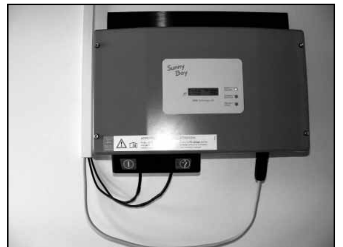
Az első Sunny Boy eljuttott Sarkadra