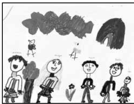
Brád Tamara és rajza