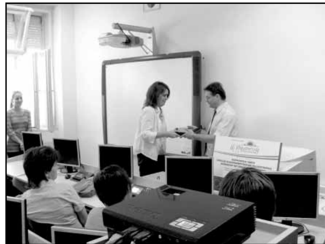
A kép a projektátadó rendezvényen készült

A projekt az Európai Unió támogatásával, az Európai Szociális Alap társfinanszírozásával valósul meg.