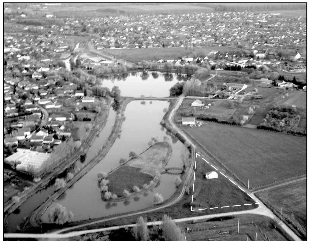
Előtérben az Éden-tó II. a kis szigettel, a fehér szaggatott vonallal határolt területre épül a turisztikai szálláshely, horgászkemping