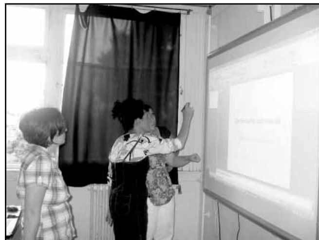
A kép a projektátadó rendezvényen készült

A projekt az Európai Unió támogatásával, az Európai Szociális Alap társfinanszírozásával valósul meg.