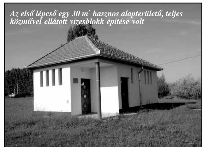
Az első lépcső egy 30 m 2 hasznos alapterületű, teljes közművel ellátott vizesblokk építése volt