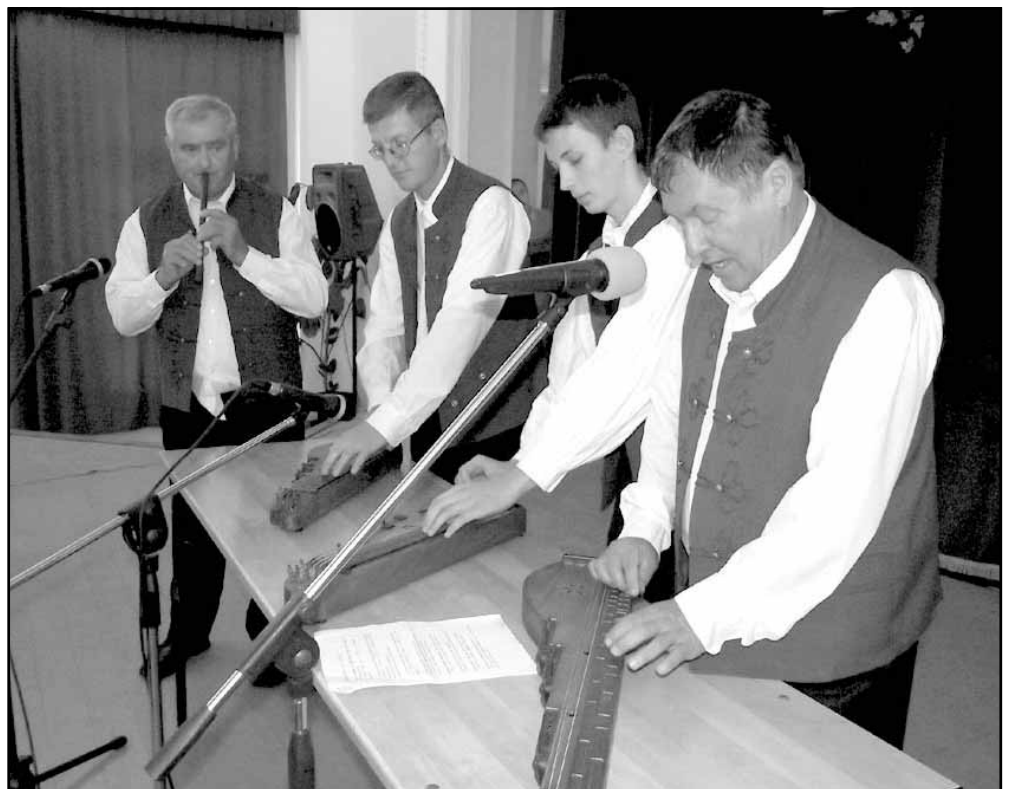
Népi hangszerek (a képen furulya és citera) hangjai is felcsendültek a találkozón

„Megmondom a titkát édesem a dalnak: Önmagát hallgatja, aki dalra hallgat. Mindenik embernek a lelkében dal van és a saját lelkét hallja minden dalban. És akinek szép a lelkében az ének, az hallja a mások énekét is szépek.”