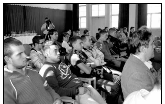
Érdeklődők egy csoportja