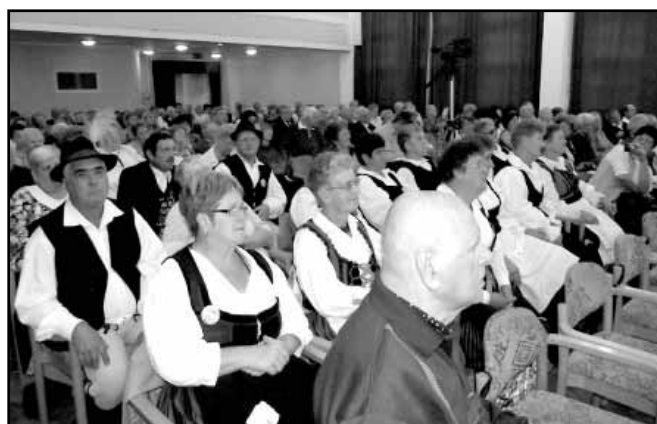
Dalosok a nézőtérén várakozás