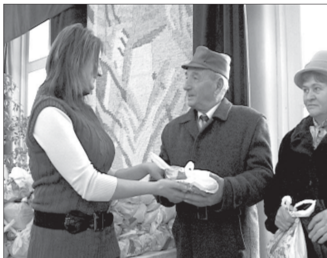
Az ünnepeket követően minden megjelentet a szervezők egy élelmiszercsomaggal ajándékoztak meg.

A köszöntő után az általános iskolák és a gimnázium tanulói szerezték műsoraikkal felejthetetlen percek, majd az ünne-