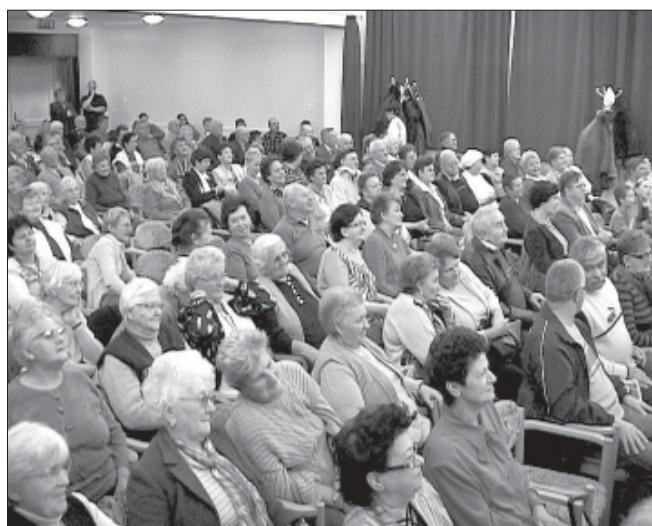
Az ünnepeltek, a város idős polgárai