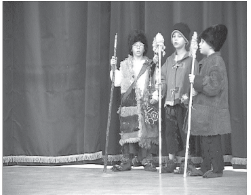
„Megjöttek a három királyok...” csak kicsibe. Egy pillanat az általános iskolások kulturális műsorából

A karácsony titkát nem lehet értelemmel megfejteni, csak átérezni lehet – akinek van hite –, átélni is csak gyermekként, az őszinte rácsodálkozás, boldog angyalvárás lelkületével. A karácsonyi örömeink a bölcsője a minden ember-