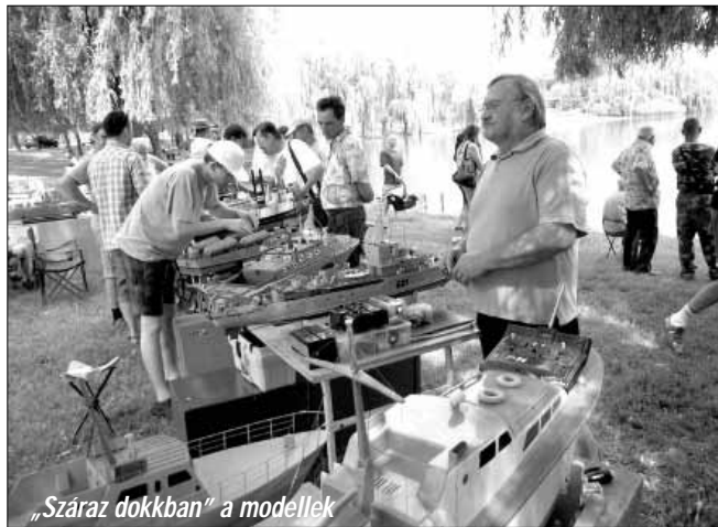
„Száras dokkban” a modellek