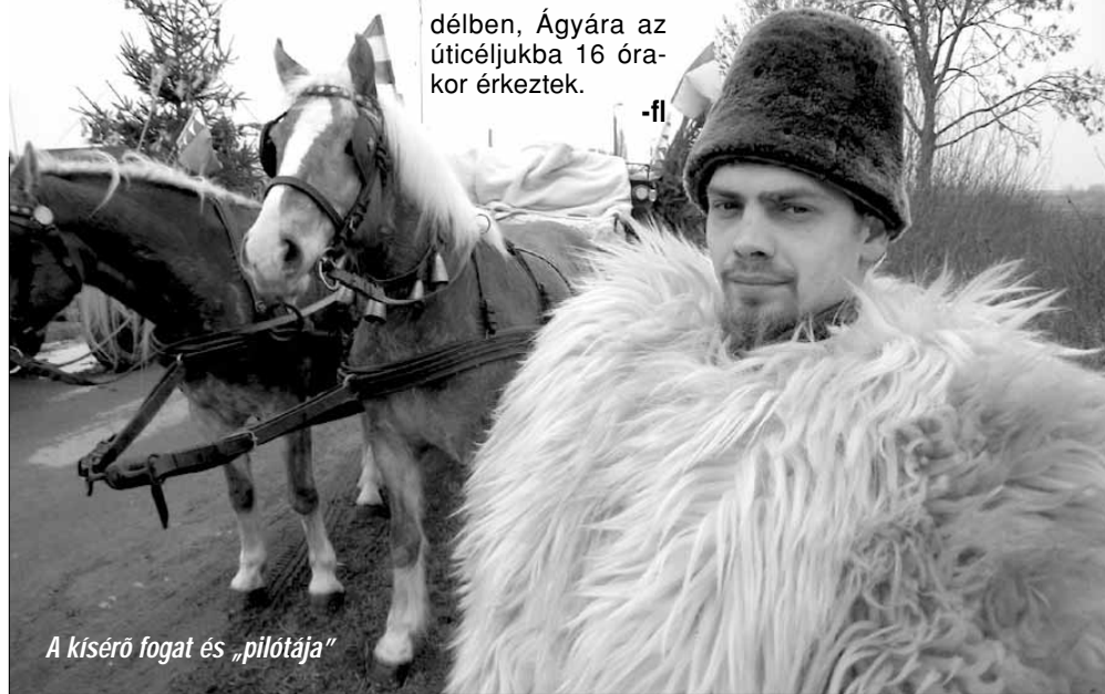
A kísérő fogat és „pilótája”