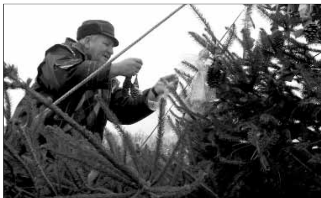
Sarkadiak díszítik a fenyőfát