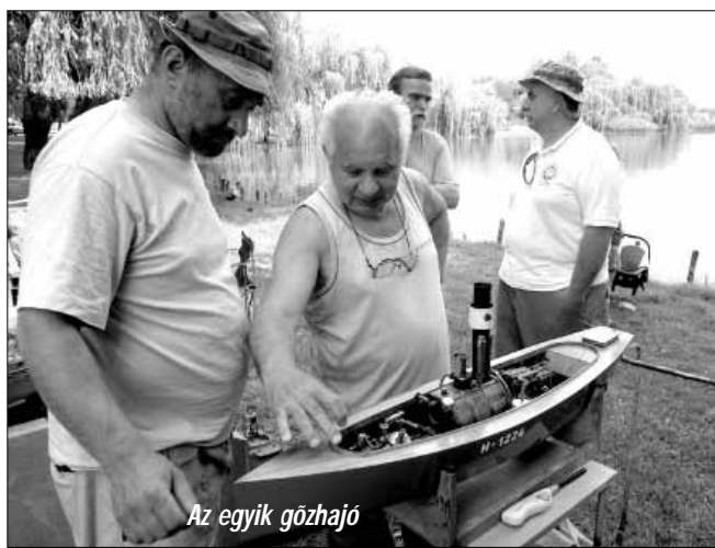
Az egyik gőzhajó