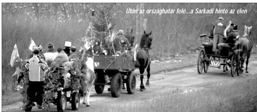
Úton az országhatár felé...a Sarkadi hintó az élen