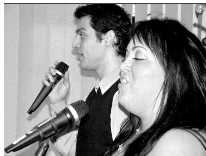
A békéscsabai Jókai Színház vendégművészei