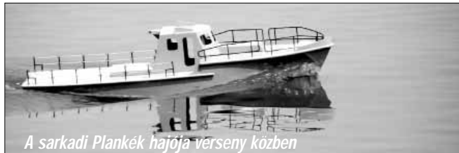
A sarkadi Plankék hajója verseny közben