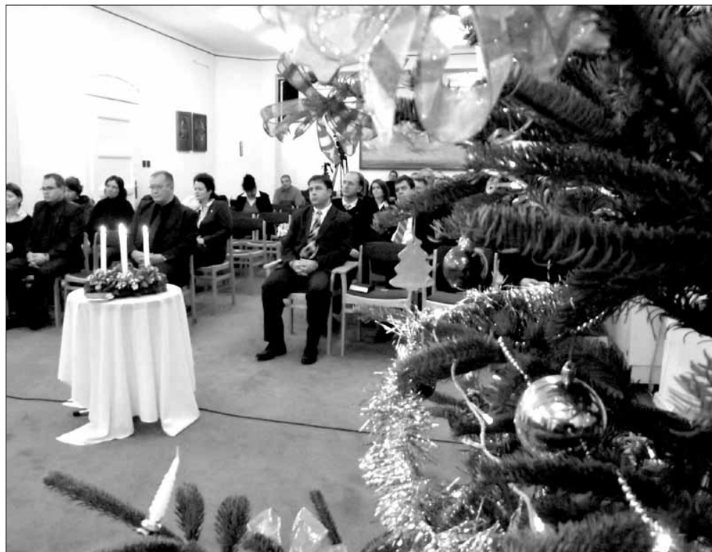
Fenyőfa a Városháza nagy tanácskozó termében