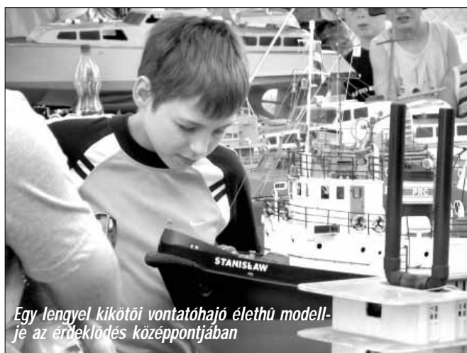
Egy lengyel kikötői vontatóhajó élethű modellje az érdeklődés középpontjában

Az elmúlt év közepén, a nyár derekán egy szép napos szombat reggelen az Éden-tó parkolója megtelt személyautókkal. Ez horgászversenyek idején megszokott látvány, ám most az autók a tetőcsomagtartóikon kisebb szekrény méretű dobozokkal érkeztek. Harmadik alkalommal gyűltek össze nálunk a hajómodellezők az Éden-tó Kupa Nemzetközi Hajómodellező Versenyre .