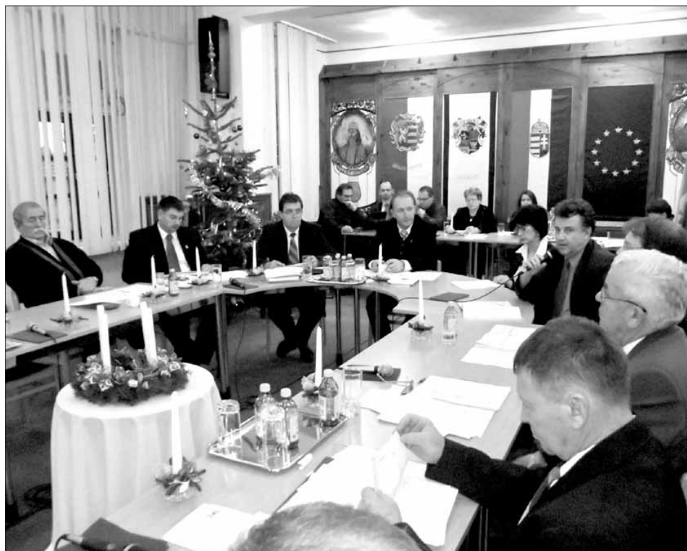
Diszes fenyőfa mellett, asztalon gyertyákkal végezte munkáját a képviselő-testület az év utolsó ülésén