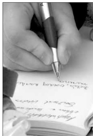
Sarkadi üzenet a fát kísérő naplóba