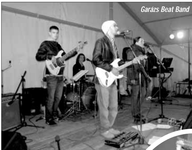
Garázs Beat Band