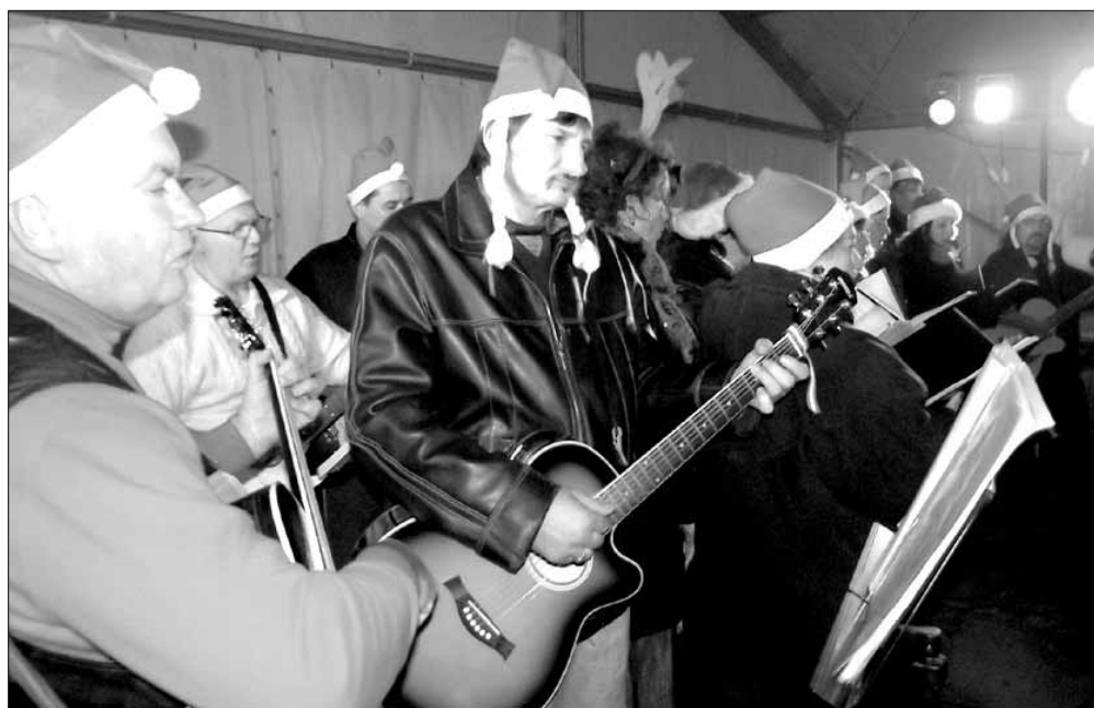
A Sarkadi Gítárklub és a Könyv Sándor Kamarakórus közös műsora

A szervezők nevében ezúton szeretnénk megköszönni valamennyi önként segítő-