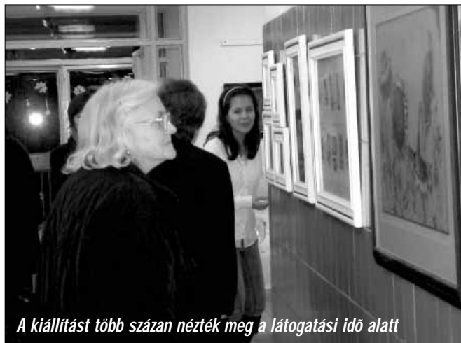
A kiállítást több százan nézték meg a látogatási idő alatt