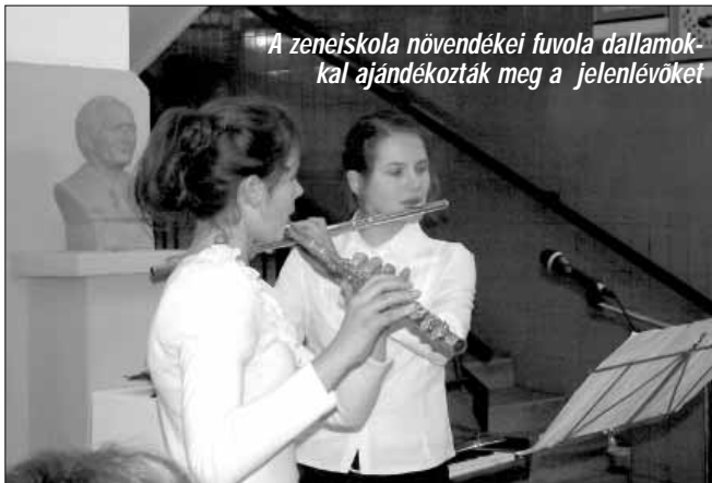
A zeneiskola növendékei fuvola dallamokkal ajándékozták meg a jelenlévőket