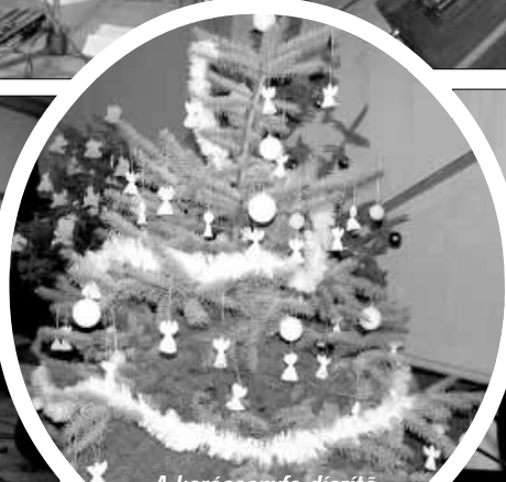
A karácsonyfa díszítő verseny győztese