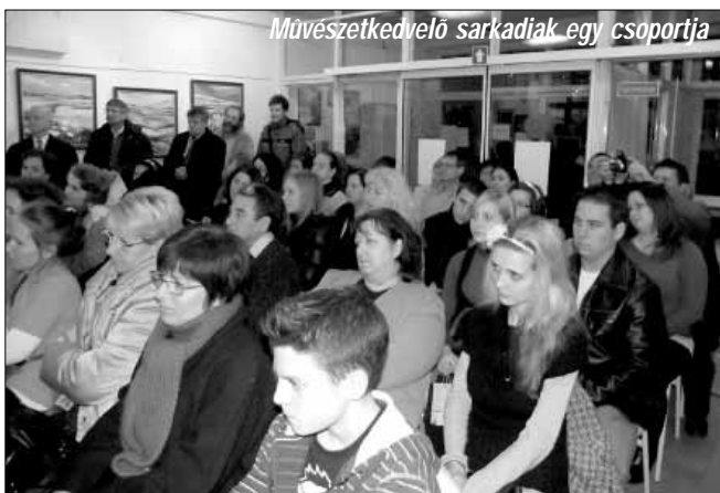
Művészetkedvelő sarkadiak egy csoportja