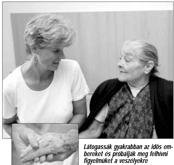
Látogassák gyakrabban az idős embereket és próbálják meg felhívni figyelmüket a veszélyekre