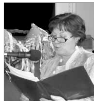
„Ez a farsang más volt, mint az előző”