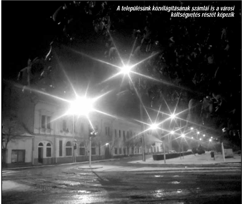
A településünk közvilágításának számlái is a városi költségvetés részét képezik

Akinek lehetősége van a helyi kábeltelevízió nyomán követni a képviselő-testület üléseit, az láthatja, hogy Sarkad városának megszületett a 2012. évi költségvetése. Gondolni kell azonban azokra is, akiknek nincs erre lehetősége, de a város pénzügyei iránt érdeklődnek, tudva, hogy ez a dokumentum, terv, közvetlenül is befolyásolhatja az életüket. Befolyásolhatja, hiszen ebből derül ki, hogy lesz-e az elkövetkező évben a városban helyi adó emelés, a dolgozók körében létszámcsökkentés, intézménybezárás, jut-e pénz a közfoglalkoztatásra, segélyekre, olyan beruházásokra, amelyek az itt élők komfortérzetét növelni tudják. Nagyon fontos kérdések ezek, ezért ez az írás a képviselő-testület által már elfogadott – hatályba lépett – költségvetési rendeletet szándékozik bemutatni, némi magyarázatot fűzve az abban szereplő adatokhoz, a pénzügyek iránt érdeklődőknek.