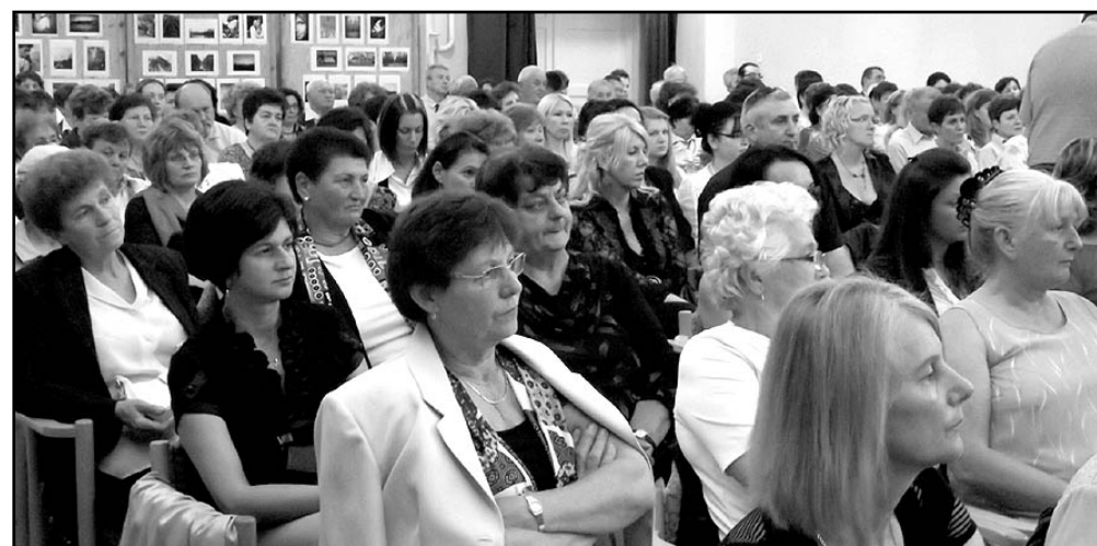
Az ünnepeltek egy csoportja