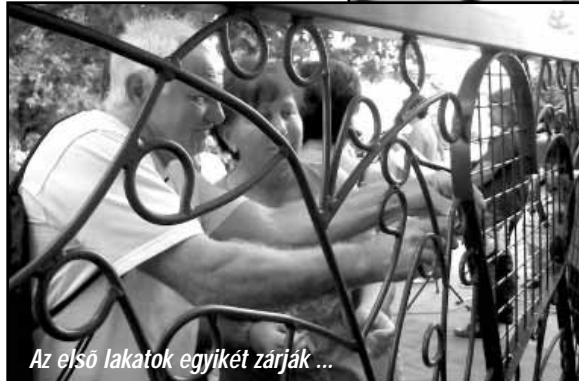
Az első lakatok egyikét zárják ...