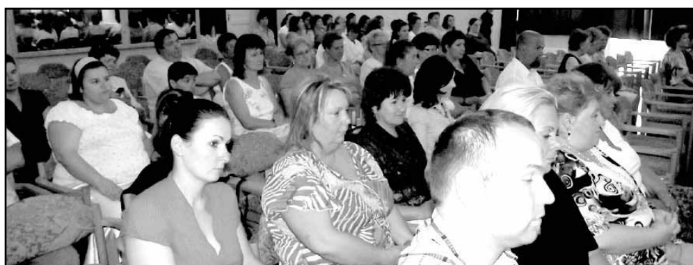
Az ünnepeltek egy csoportja