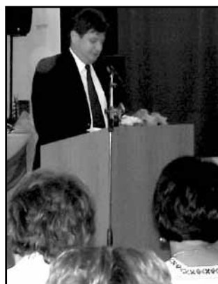
Gajda Róbert, országgyűlési képviselő

formán állt rendelkezésére a rászorulóknak, akár szegények, akár gazdagok voltak. Olyan ember volt, aki kérelhetetlen volt a tudományban és odaadó a családjában. Olyan ember volt, aki igazán biztos tudatával harcolt, de saját korában sikertelenül. Hazájában életében, soha nem kapta meg az őt megillető elismerést, csak jóval halála után adóztak méltóképpen munkásságának.