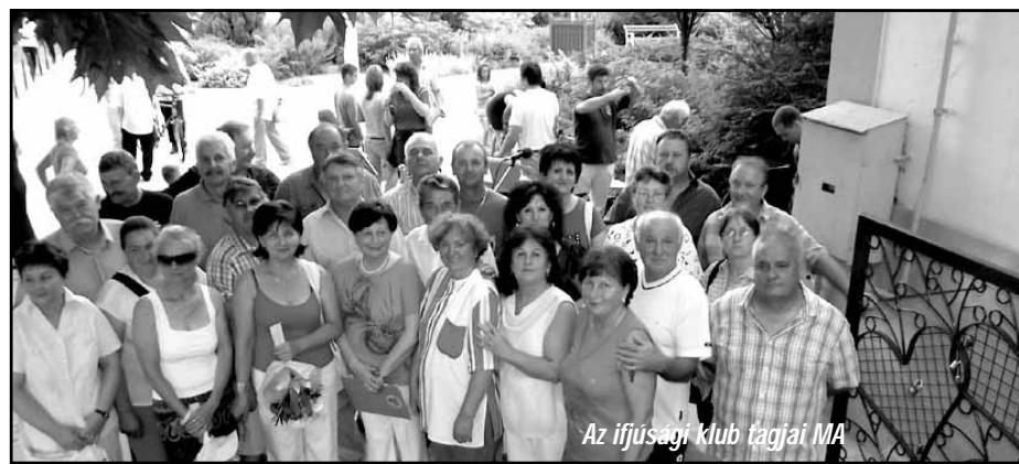
Az ifjúsági klub tagjai MA