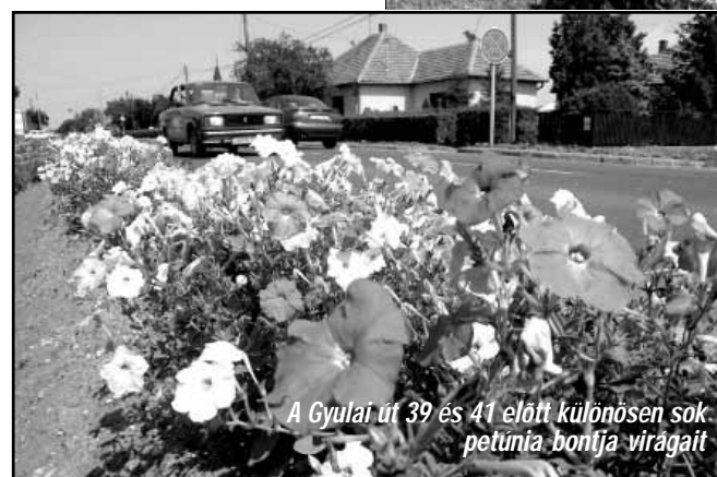
A Gyulai út 39 és 41 előtt különösen sok petúnia bontja virágait