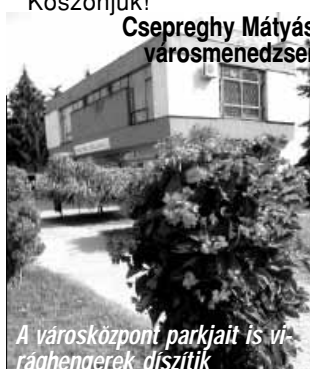
A városközpont parkjait is virághengerek díszítik

légedés, ami a lakosság részéről az egész programot fogadta, azonban az önkormányzat hálás köszönettel tartozik az Arvai-féle kertészetnek is, akik nemcsak a kivitelezésben segítettek, hanem nagylelkű felajánlással is segítették a virágosítást, ugyanis 3 db virághenger és mind a 10.000 petúnia a kertészet önzetlen felajánlása. Köszönjük!