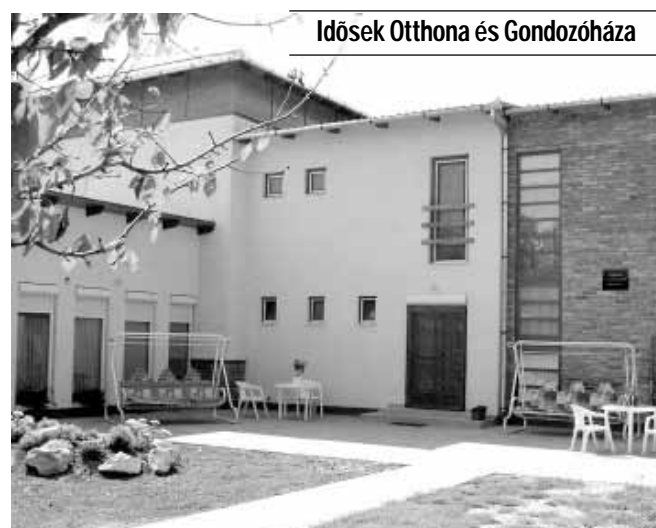
Idősek Otthona és Gondozóháza

A Gyulai u. 8. szám alatti Idősek Otthona és Gondozóháza akadálymentesített, parkosított, kellemes környezetben, családi légkörben, emelt szintű 2 ágyas, fürdőszobás szobákkal várja az idősek jelentkezését. Az otthon komplex, személyre szóló teljes körű ellátás, aktív pihenés keretében biztosítja lakói számára a kiegyensúlyozott életet.