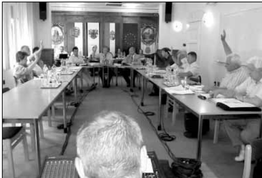
A második napirendi pont zárószavazása...

A harmadik pontban a városban működő oktatási intézmények vezetőinek beszámolója következett az ideai tanévkezdés tapasztalatairól, a tanévkezdéshez kapcsolódó aktualításokról, majd rendeleteket módosított a képviselő-testület. Ennek