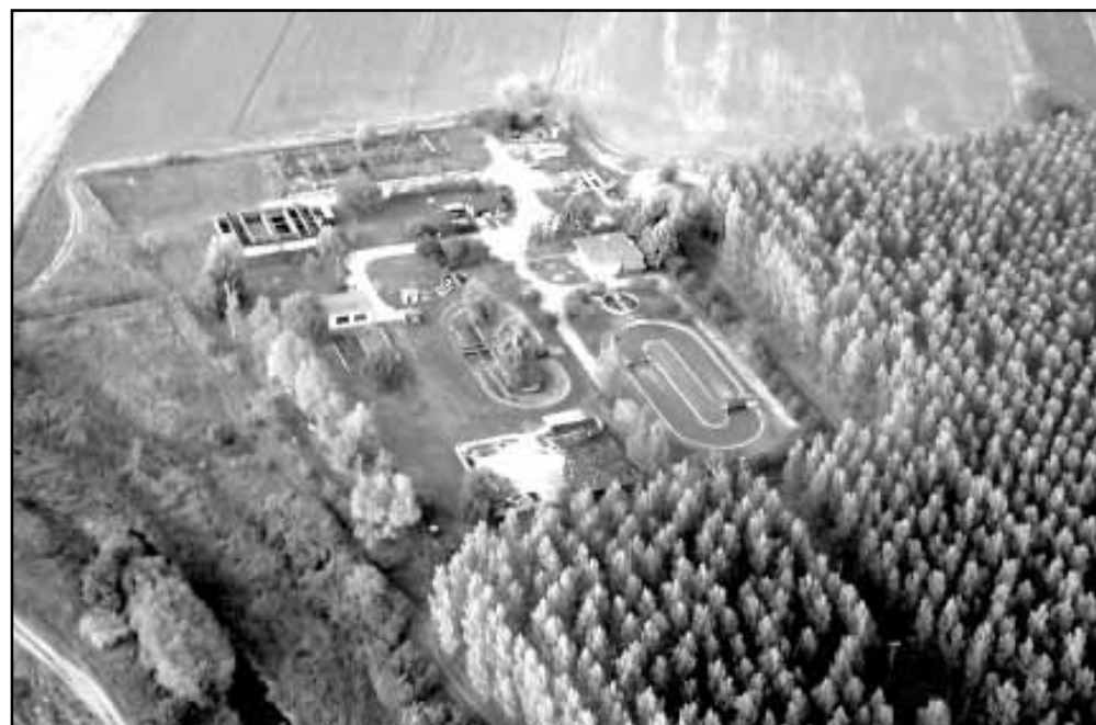
A város eddigi legnagyobb projektje, a szennyvíztisztító telep (látképe a magasból) rekonstrukciója

Az eddigi, s az ez utáni befizetések felhasználása is az új szakaszok megépítését van hivatva szolgálni, így alaptalan az a szóbeszéd, hogy a fejlesztés elmarad,