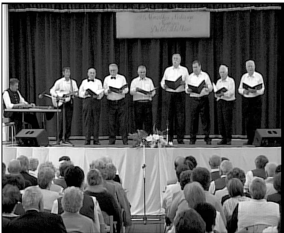
Színpadon a sarkadi Fehér Kakasok férfikórus

A sarkadi Nyugdijasok Érdekvédelmi Egyesülete szervezésében október 12-én a Bartók Béla Művelődési Központban került sor a VI. Nemzetközi Kistérségi Nyugdijas Dalos Találkozóra. Tehát immár hatodik alkalommal nyújtunk lehetőséget a város, a kistérség és a határon túlról érkező nyugdíjasoknak arra, hogy éneklésüket, előadói képességüket megmutathassák. Egyre szélesebb a fellépők köre (Nagyvárad és Nagyszalonta nyugdíjasai, nótafái is eljöttek) és velük együtt a műfajok köre is bővült. Kilenc kórus és szólisták sora lépett színpadra, összesen közel 200 fő. Felcsendültek népdalok, virágénekek, magyar nóták, operettek, hazafias dalok, és népszerű slágerek is.