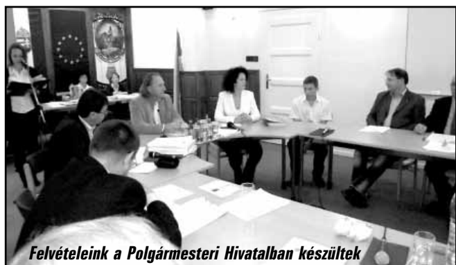
Felvételeink a Polgármesteri Hivatalban készültek

Az Ady Endre - Bay Zoltán Középiskola és Kollégium tantestülete 2010 tavaszán ösztöndíjrendszert dolgozott ki és fogadott el.