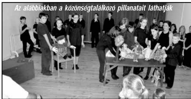
Az alábbiakban a közönségtalálkozó pillanatait láthatják