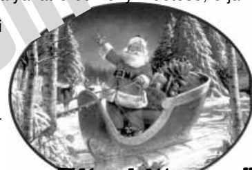
„Tálapó itt van...” Sarkad Város Óvoda dolgozó