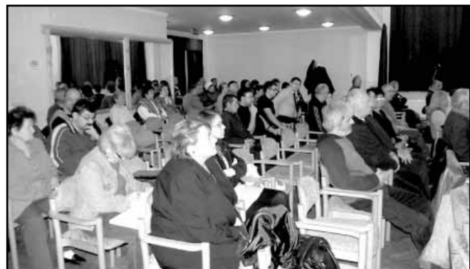
Az érdeklődő sarkadiak egy csoportja

„Keressük meg Magyarországot a világtérképen! Szép és termékeny ország, bátor és intelligens nép lakja. Hatvan évvel ezelőtt a magyarok - akárcsak az írek - szolgátságban éltek. Manapság szabad és virágzó nemzetként foglalnak helyet a vezető európai államok sorában. Egy kurta emberöltővel ezelőtt az osztrák kétféjű sas magyar vérben fürdött, s diadalittasan körözött a leigázott ország felett.” Az előbbi sorokat Arthur Griffith (1872-1922) írta „Magyarország fel-támadása. Párhuzam Írország számára” c. 1904-ben megjelent nagy hatású könyvében. A művet tanulmányozta M. Gandhi és Dzs. Nehru is, erőt és követező példákat találva benne India felszabadításához. (Írország és India fiai hamar egymásra találtak, mert elnyomójuk ugyanaz volt: Anglia.) A Griffith 1921-22-ben a függetlenné vált Írország első elnöke lett. Az általa leírt „magyar út” az írek számára is jónak bizonyult. (Sz1)