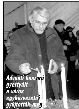
Adventi koszorú gyertyáit a város egyházvezetői gyújtották meg