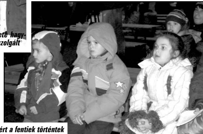
És a közönség, akikért a fentiek törtétek