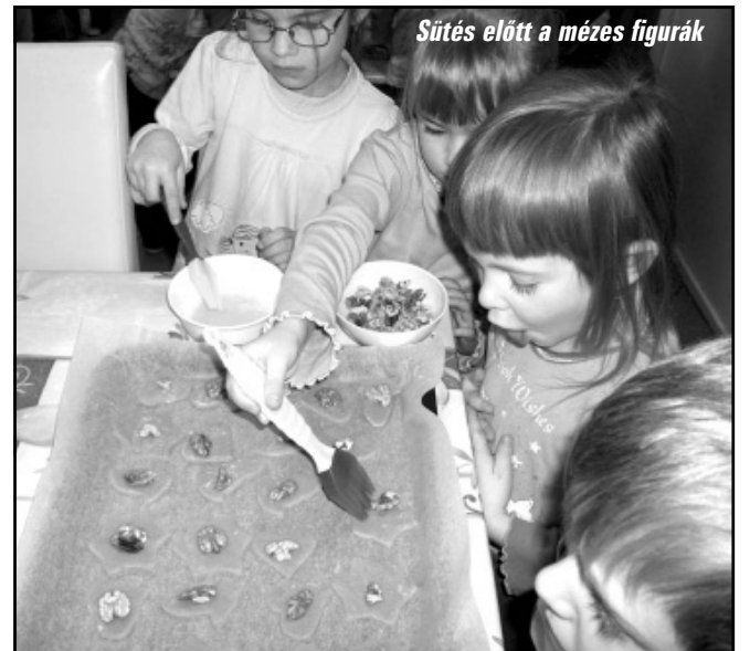
Sütés előtt a mézes figurák