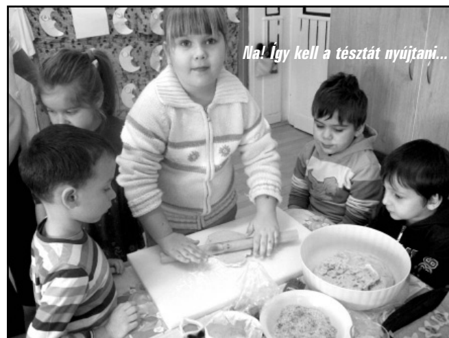
Na! Így kell a tészta nyújtani...