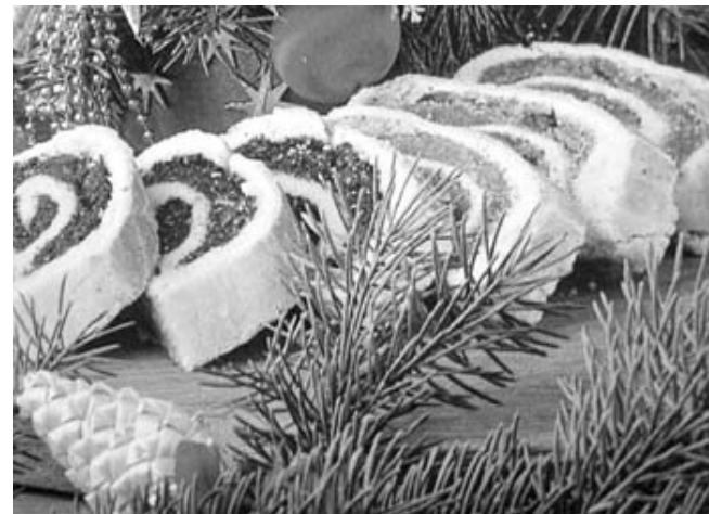
"Karácsonykor kalácsot, ..."

Karácsony az egész világ számára a béke, a szeretet ünnepe. Jézus születésének napja, az egyház egyik legnagyobb ünnepe. Hazánkban számos népszokás, hiedelem kapcsolódik Adám-Eva napjához (december 24.), valamint Karácsony napjához (december 25-26).