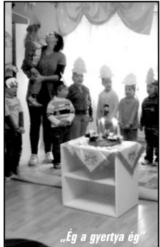
„Ég a gyertya ég”