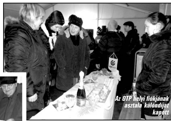
Az OTP helyi fiókjának asztala különdíjat kapott