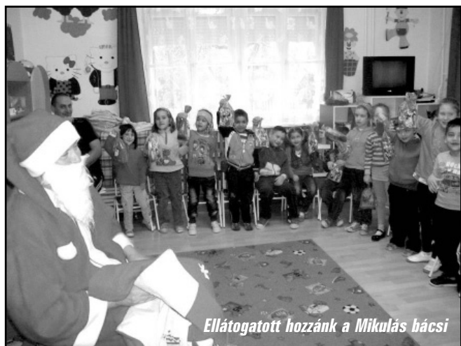
Ellátogatott hozzánk a Mikulás bácsi