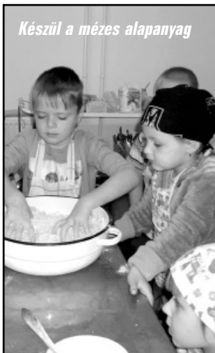
Készül a mézes alapanyag