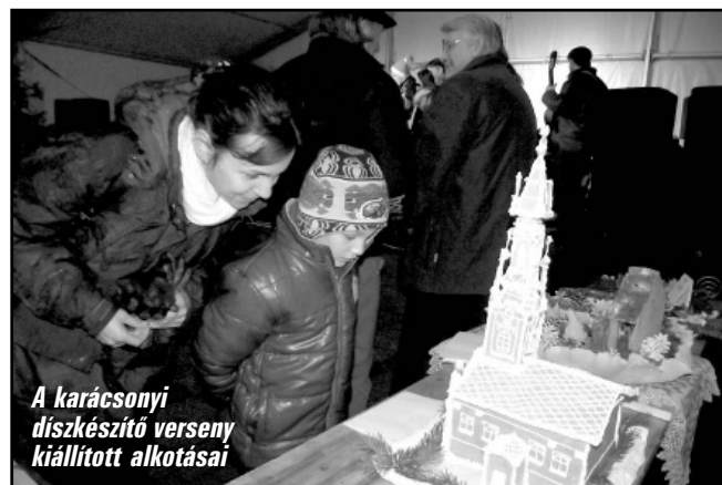
A karácsonyi díszkészítő verseny kiállított alkotásai