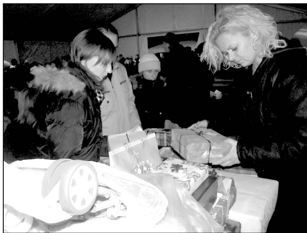
Szeretettel hozták az ajándécsomagokat a Mikulásgyár asztalára a sarkadiak sarkadiaknak...