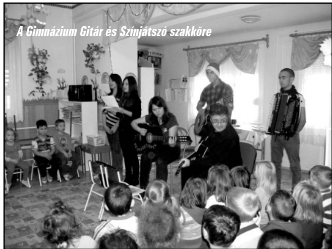
A Gimnázium Gitár és Színjátszó szakköre