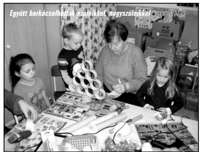
Együtt barkácsolhattak szüleikkel, nagyszüleikkel

A Kossuth Utcai Óvoda munkaközössége és gyermekei