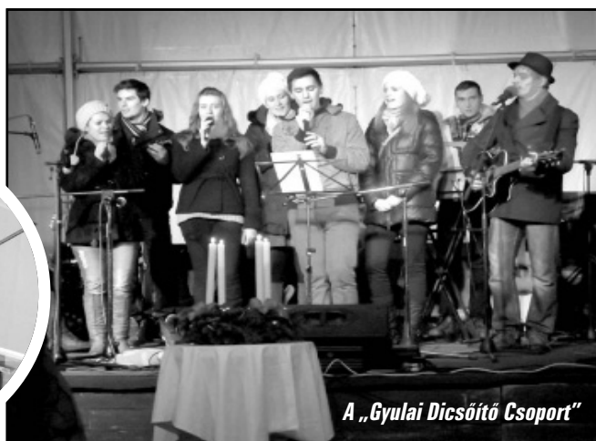
A „Gyulai Dicsőítő Csoport”