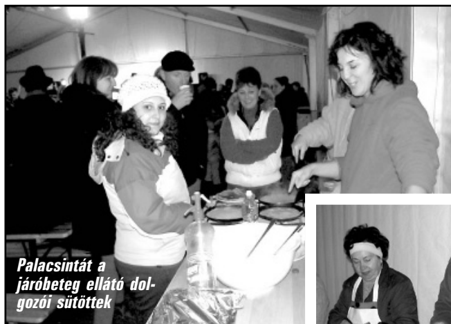
Palacsintát a járóbeteg ellátó dolgozói sütöttek