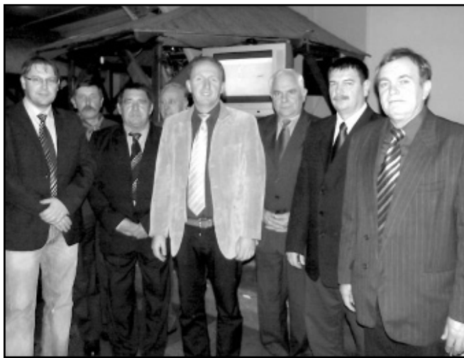
A város- és az Ipartestület vezetése az évzáró összejövetelen