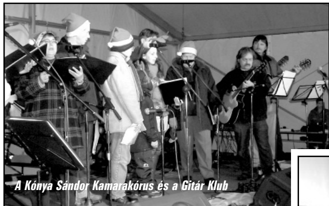
A Kónya Sándor Kamarakórus és a Gitár Klub