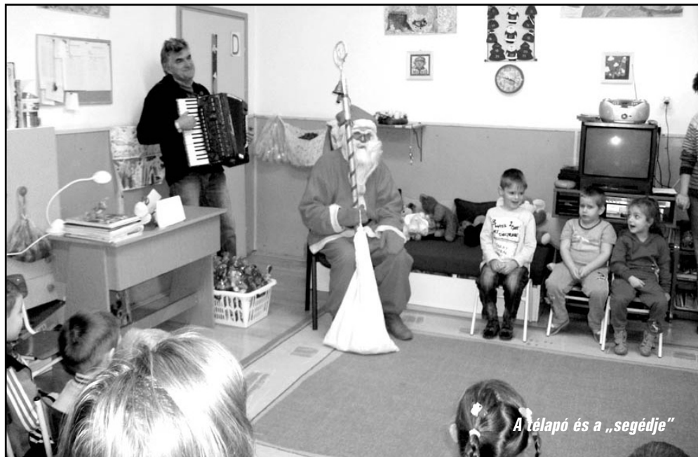
A télapó és a „segédje”

33. éve járnak óvodánkba álruhában mint Mikulás és zenés krampusza