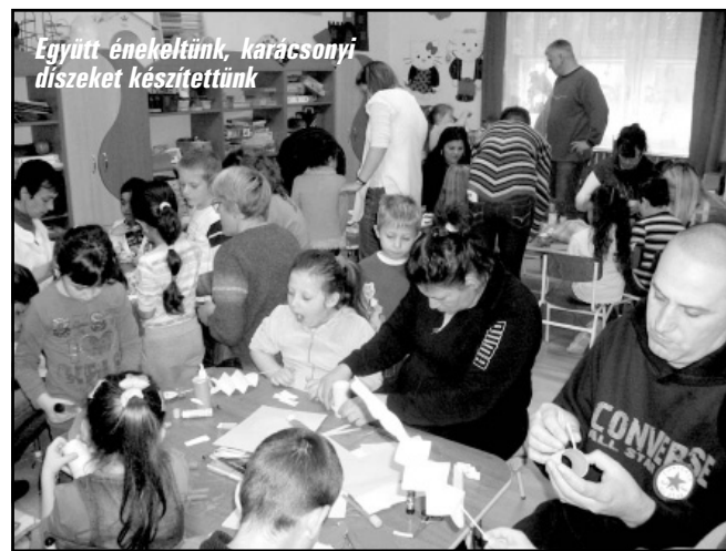
Együtt énekeltünk, karácsonyi díszeket készítettünk