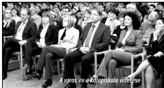
A város és a középiskola vezetése