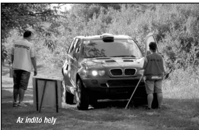
Az indító hely