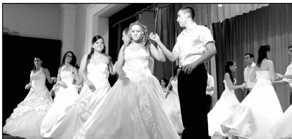
Az osztályok tánca: mindannyian bécsi keringőt adtak elő

Ezt követően a két végzős osztály bemutatkozó műsorára került sor. A 13.C vidám, táncos, zenés „jelenettel” készült, majd középiskolai