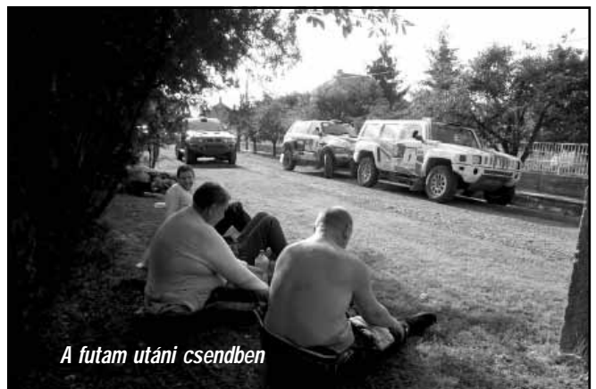
A futam utáni csendben