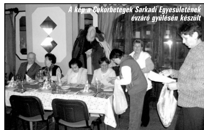
A kép a Cukorbeteg Sarkadi Egyesületének évzáró gyűlésén készült