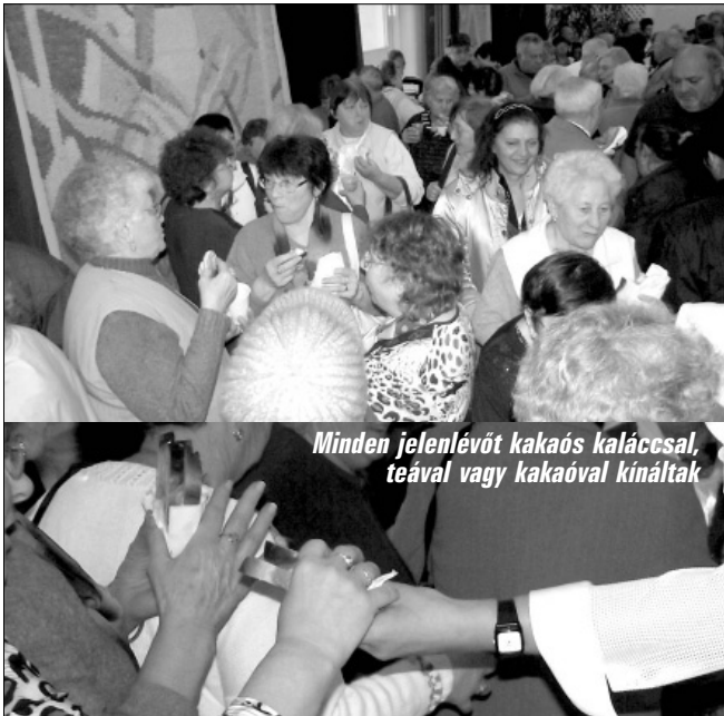
Minden jelenlét kakaós kaláccsal, teával vagy kakaóval kínáltak