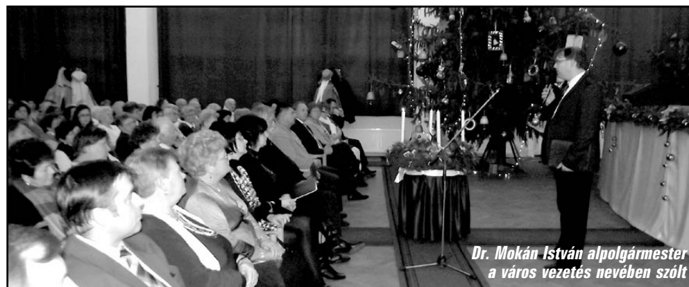
Dr. Mokán István alpolgármester a város vezetés nevében szőtt