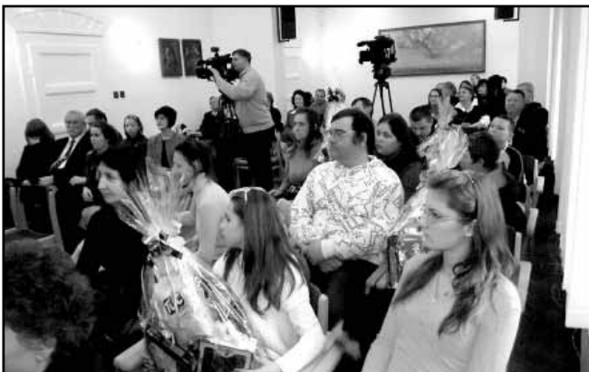
A megajándékozottak csoportja a Városháza tanácskozó termében

2013. február 9-én (szombaton) 8.00órákor kezdődő horgász közgyűlésére. Határozatképtelenség esetén a közgyűlés 9.00 órai kezdettel kerül megrendezésre.