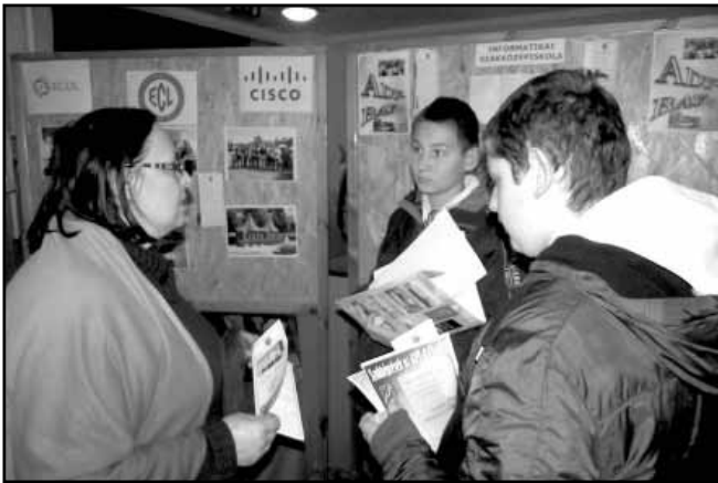
A sarkadi Ady Endre - Bay Zoltán Középiskola és Kollégium „standja”

kaügyi Központ tájékoztatót tartott a fiatalok által igénybe vehető támogatási formákról és a TOP 10 szakmáról.