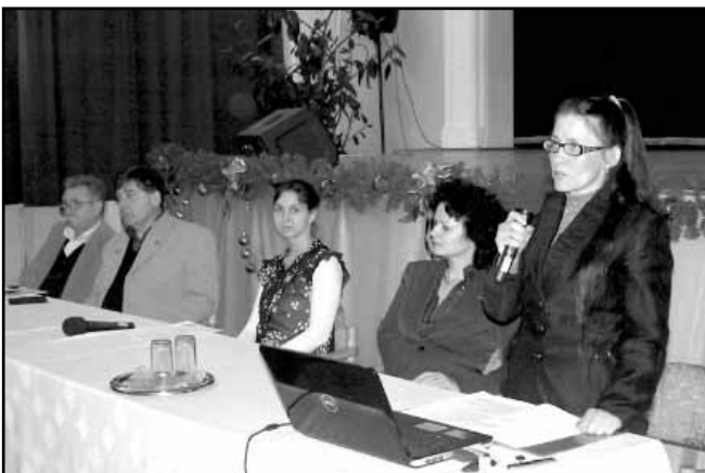
Az iskolák képviselői bemutatták intézményeiket

A Békés Megyei Kormányhivatal Munkaügyi Központjának Sarkadi Kirendeltségével történt együttműködés eredményeképpen a kistérség tanulói részt vettek a 2012. november 8-án és 9-én megrendezett megyei Pályaválasztási Vásáron, melynek mintájára kistérségi pályaválasztási délutánt szerveztünk 2012. december 5-én. A rendezvény célja a pályaválasztás és a szakmák megismertetése volt, illetve a Munkaügyi Központ tájékoztatót tartott a fiatalok által igénybe vehető támogatási formákról és a TOP 10 szakmáról.