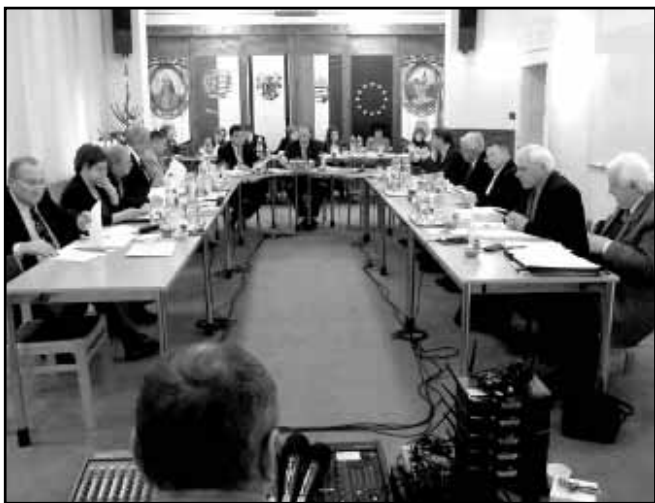
Az adventi ünnepséget követően kezdetét vette a munkaiülés