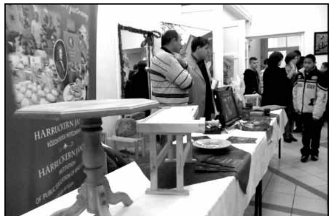
A Békés Megyei Harruckern János Közoktatási Intézmény látóvalói