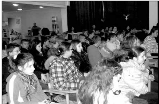
A kistérség általános iskoláinak végzős diákjai

A Sarkad és környéke Többcélú Kistérségi Társulás által megpályázott és elnyert TAMOP-5.2.3-A-11/1-2011-0002 „Együtt gyermekeink jövőjéért” – a Sarkadi Kistérség integrált programja elnevezésű projekt „Pályaorientáció” programelem keretén belül megszervezett tevékenységekkel kívánt segítséget nyújtani a továbbtanulás előtt álló diákoknak, a megfelelő szakma és képző intézmény kiválasztásában.