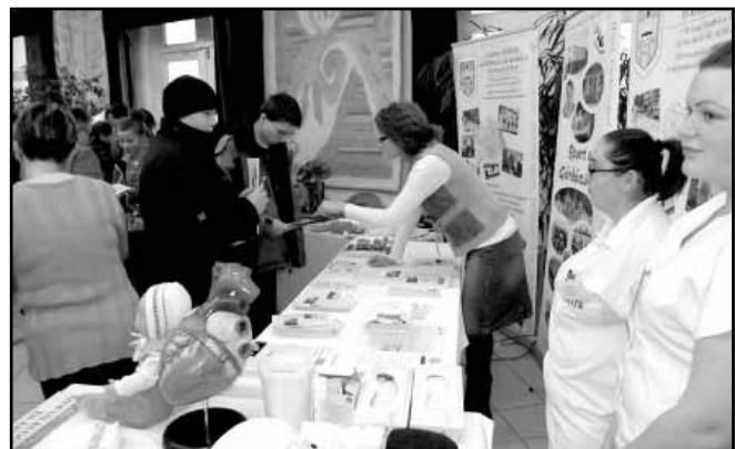
A Göndöcs Benedek Középiskola, Szakiskola és Kollégium bemutatója

A projekt az Európai Unió támogatásával, az Európai Szociális Alap társfinanszírozásával valósul meg.